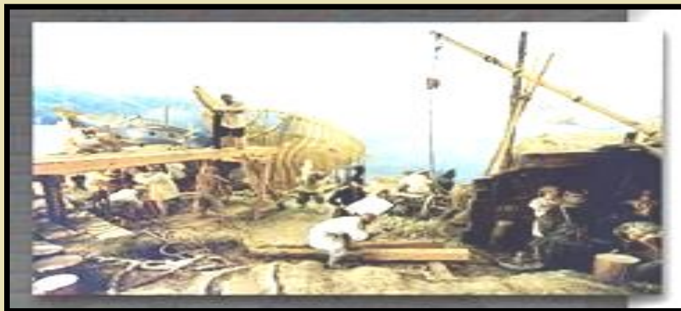
Школа №3 г Дмитрова

По указу из приказа военных дел «взято в солдаты 51 человек для Таганрогу и в Лодейном Поле в конопатчиках и кузнецах 12 человек, Петербурхе в работниках 12 человек, да в Дмитрове у таможенных сборов и у рыбных ловель, по выбору в бурмистрах ...70 человек и всего в солдаты взято и в вышеописанных службах... 156 человек»