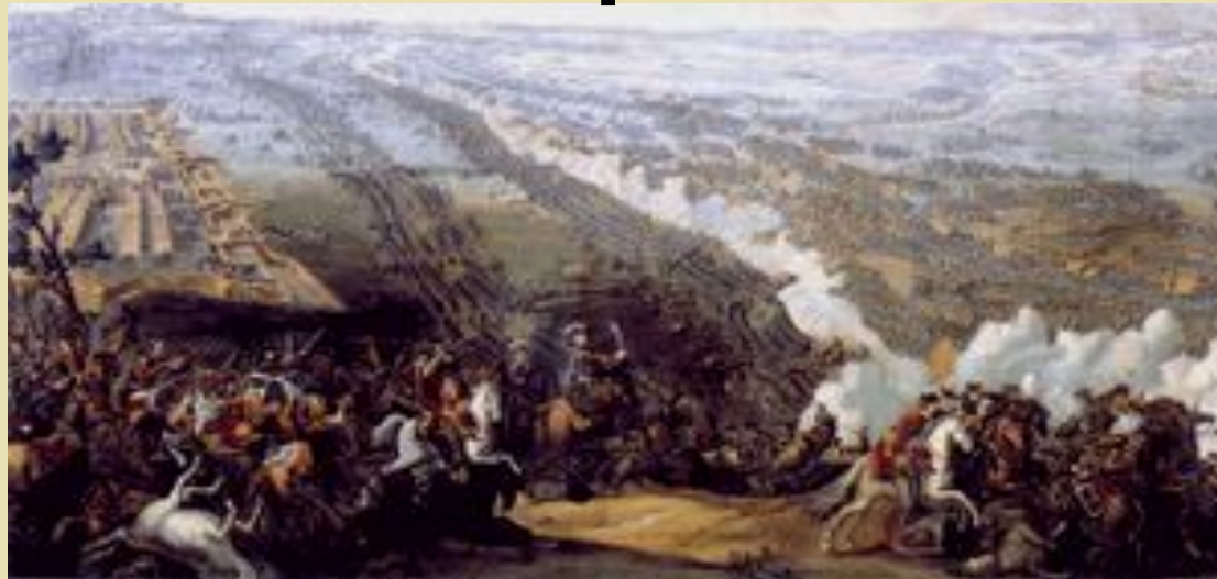
Школа №3 г. Дмитрова