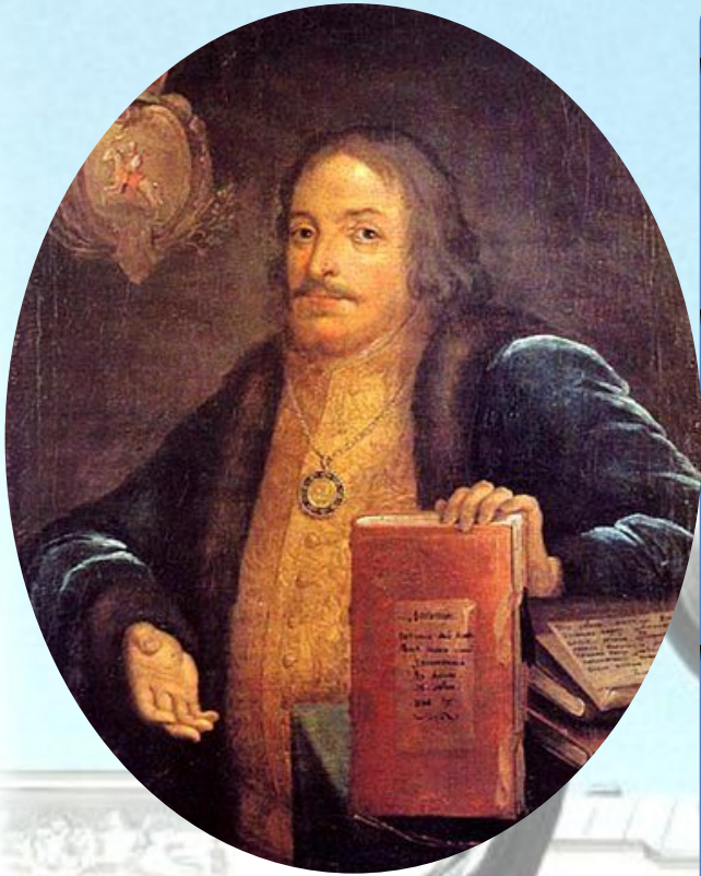
Василий Васильевич Голицын (1643—1714)