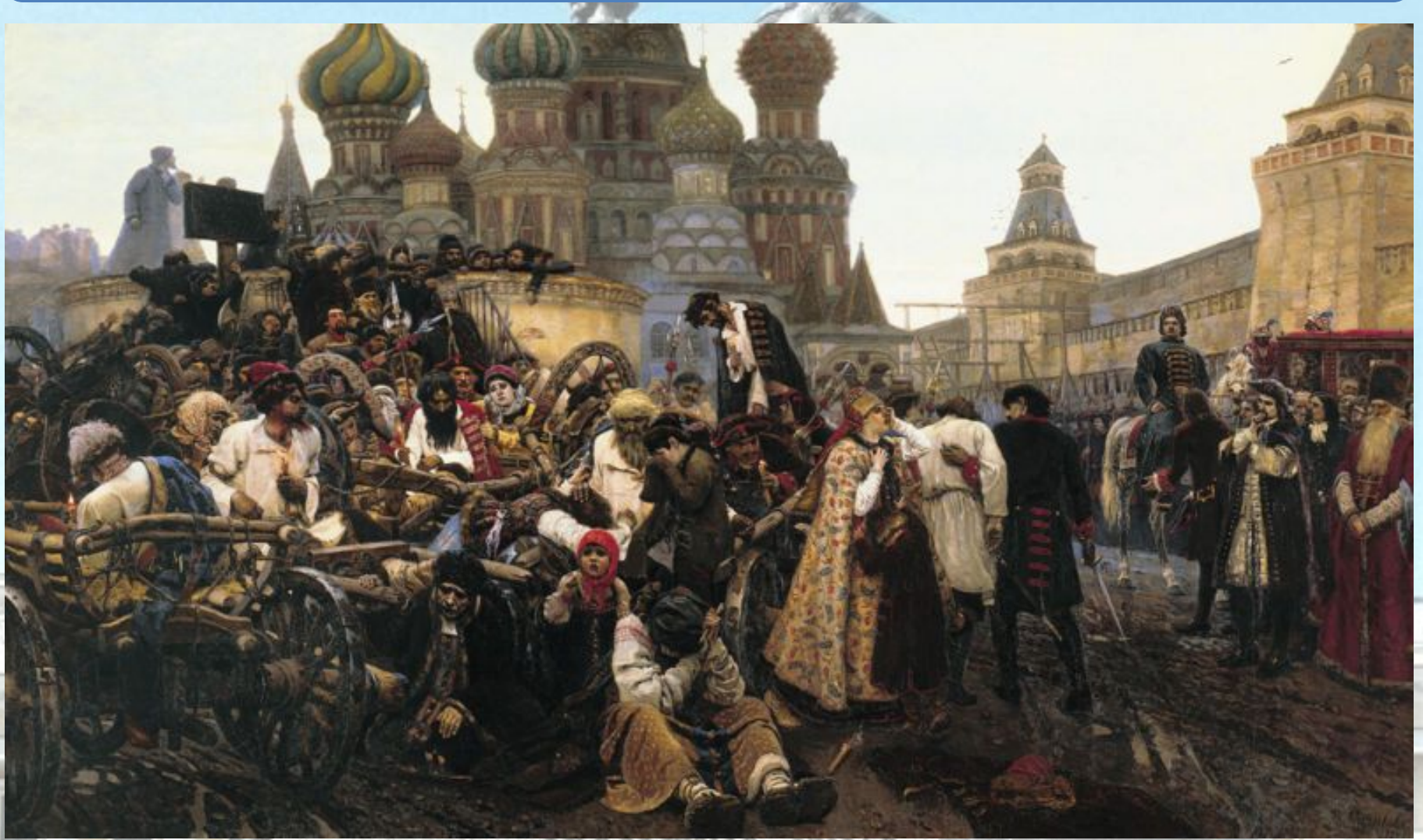
«Утро стрелецкой казни». Картина В. И. Сурикова