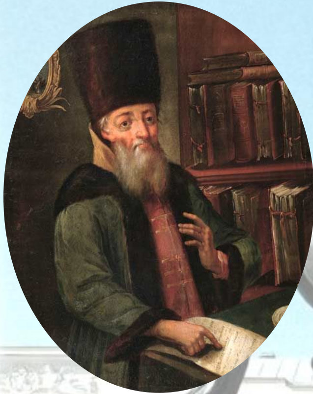
Афанасий Лаврентьевич Ордин-Нащокин (1605—1680)