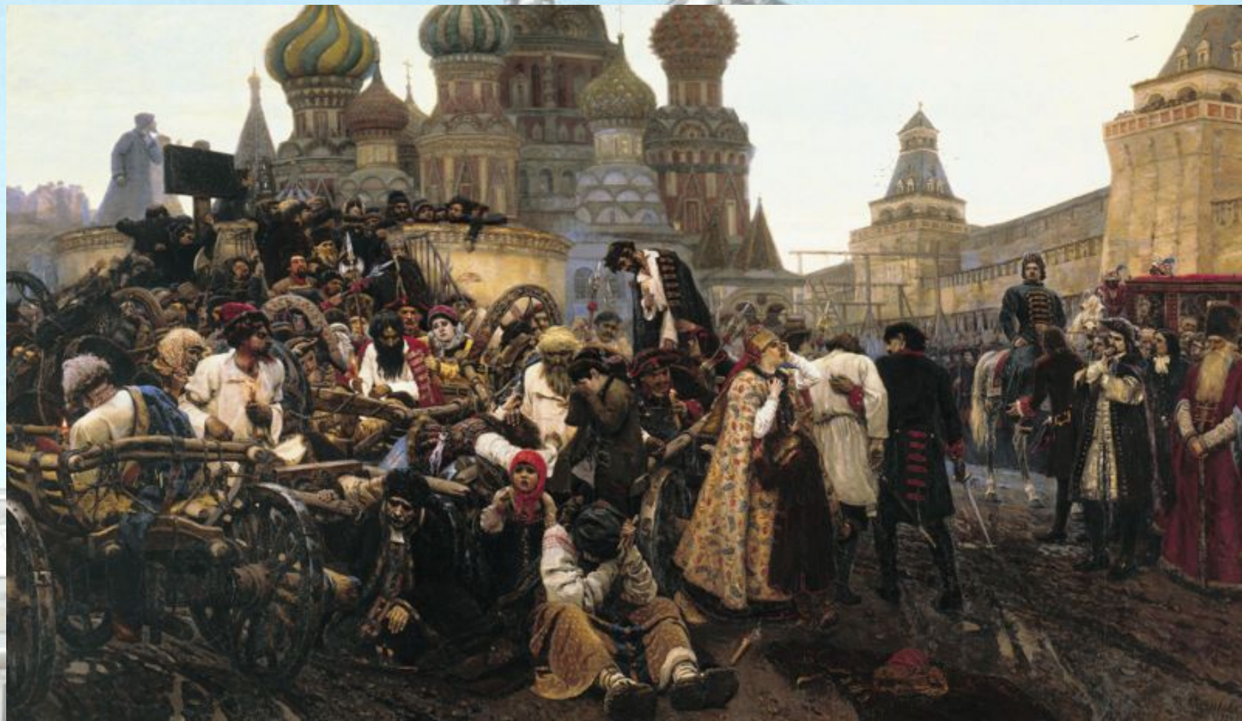
«Утро стрелецкой казни». Картина В. И. Сурикова