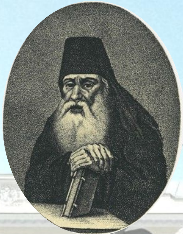
Симеон Полоцкий (1629—1680)