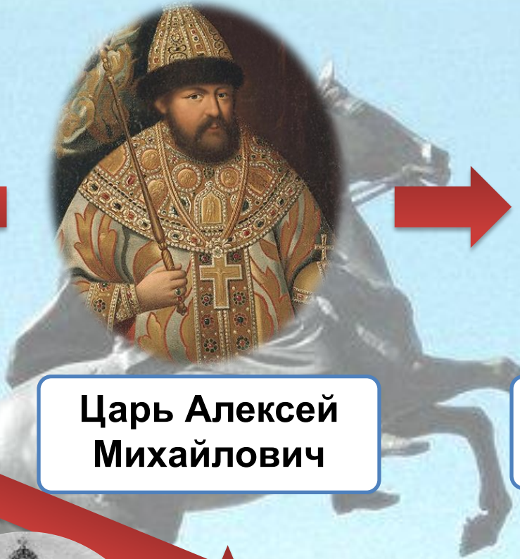
Царь Алексей Михайлович