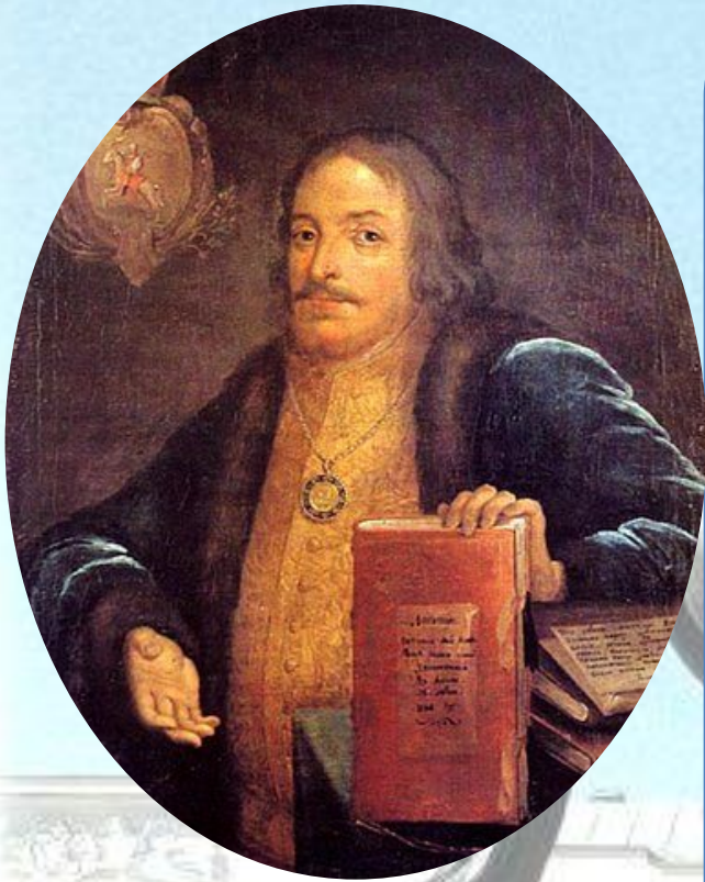
Василий Васильевич Голицын (1643—1714)