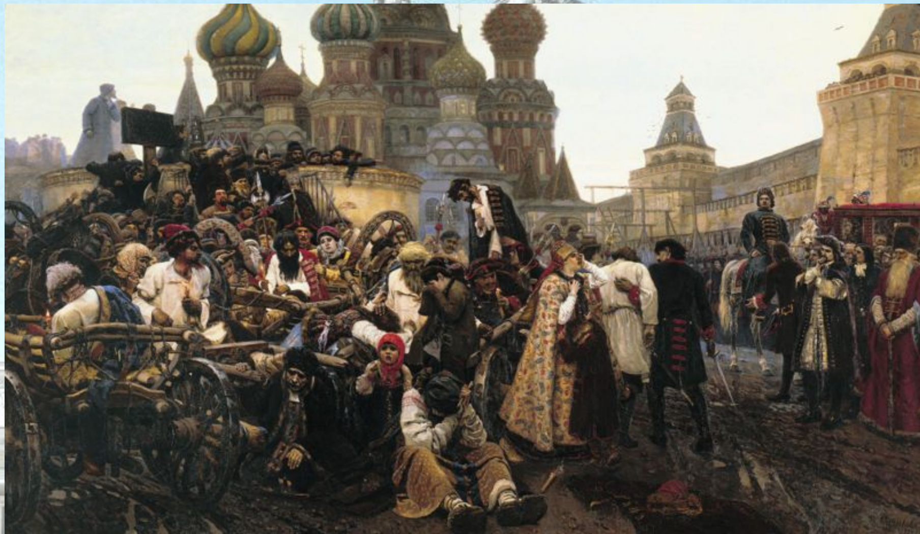
«Утро стрелецкой казни». Картина В. И. Сурикова