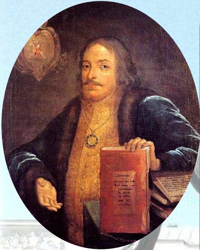
Василий Васильевич Голицын (1643—1714)