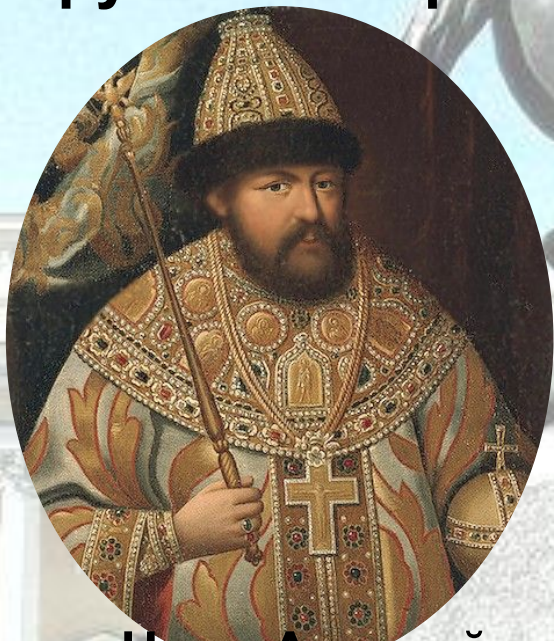
Царь Алексей Михайлович