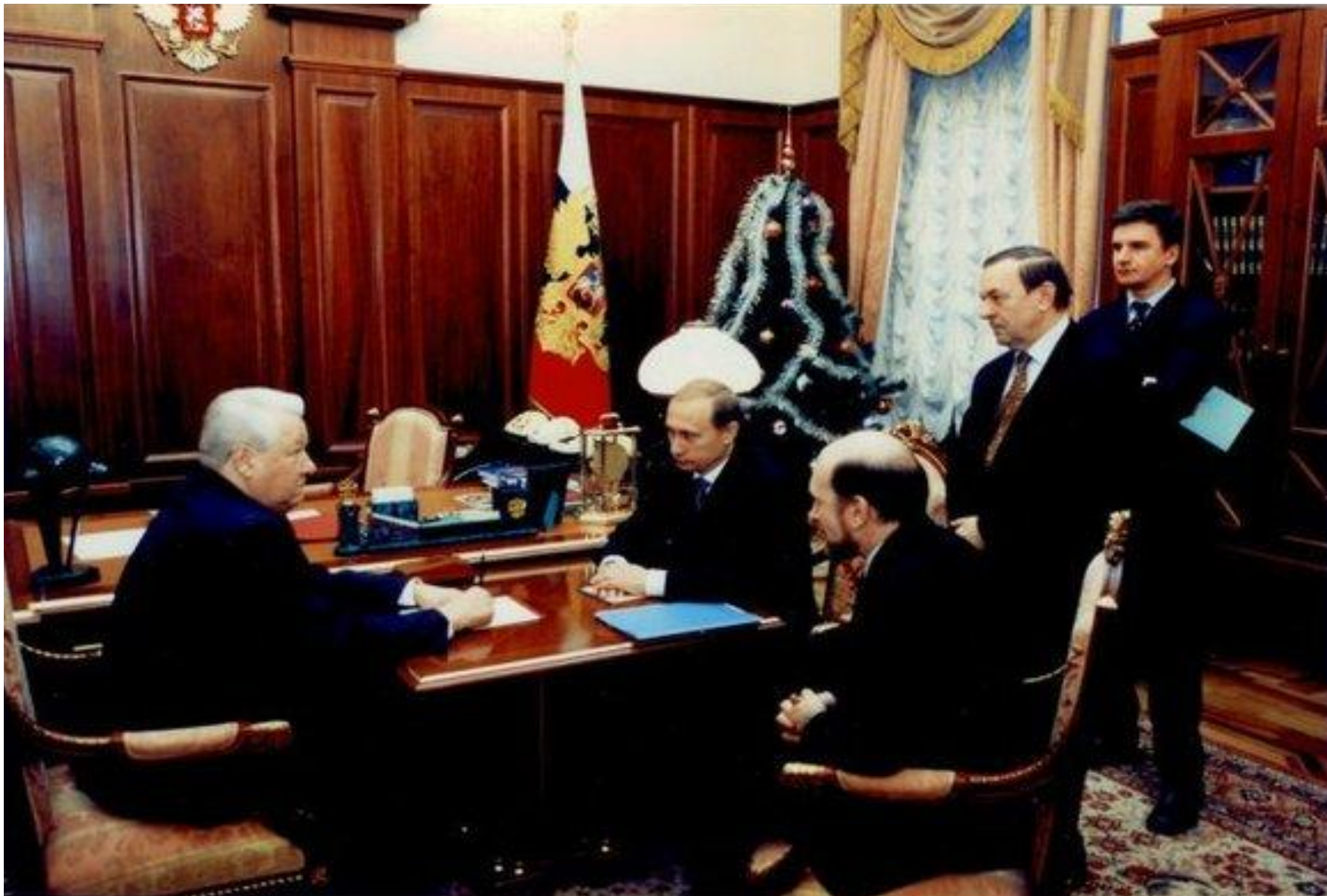
Утро 31 декабря 1999 года в кабинете президента в Кремле.