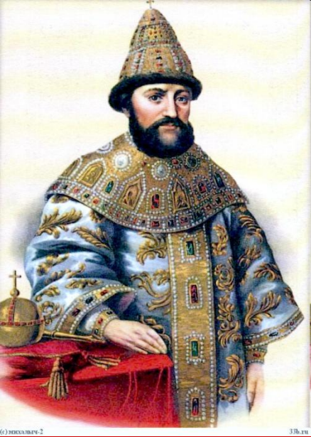
Михаил Федорович Романов (1613-1645)