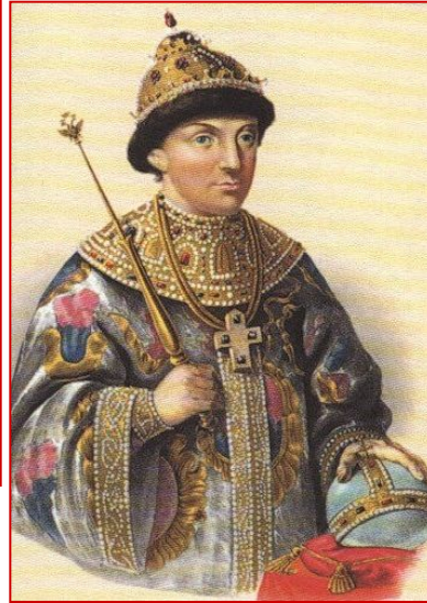
Федор Алексеевич Романов (1676-1682)