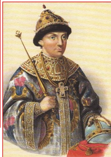
Федор Алексеевич Романов (1676-1682)