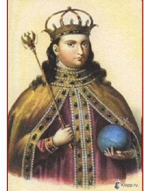
Царевна Софья Алексеевна (1682-1689)