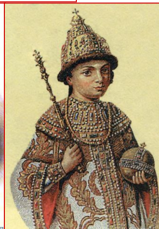
Петр Алексеевич Романов (1682-1725)