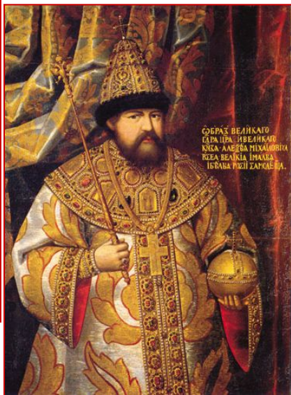
Алексей Михайлович Романов (1645-1676)