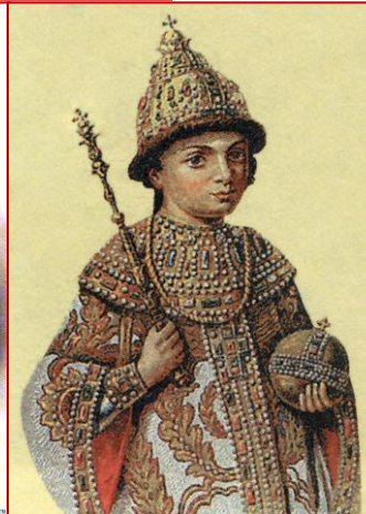
Петр Алексеевич Романов (1682-1725)