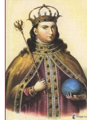
Царевна Софья Алексеевна (1682-1689)