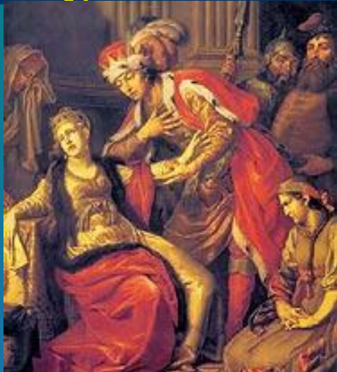
Прощание Владимира с Рогнедой