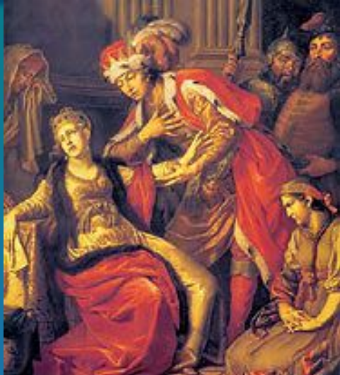
Прощание Владимира с Рогнедой