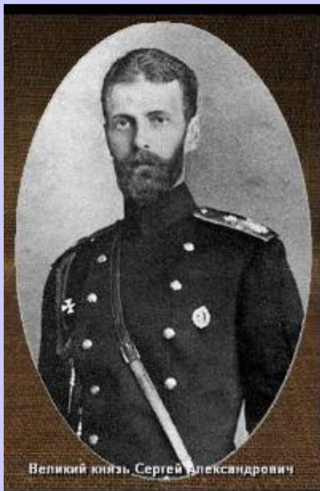
Великий князь Сергей Александрович

При поддержке московско-го генерал-губернатора в.к. Сергея Александровича в Москве были созданы легальные профсоюзы. Их членам предоставлялись льготы, для них устраивались воскресные школы, лечебные учреждения. Руководители «полицейского социализма» не запрещали рабочим участвовать в экономических стачках. После волны стачек 1902-4 гг. в правительство пошли жалобы от фабрикантов и профсоюзы были распущены. А в 1904 г. Плеве был убит эсерами.