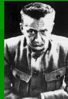
А. Ф. Керенский