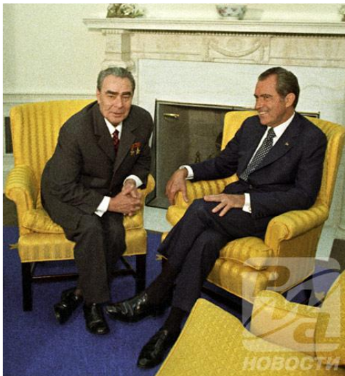
Никсон и Брежнев