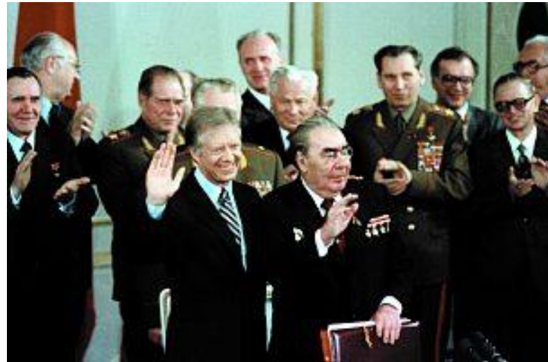
Брежнев и президент США Картер на подписании договора ОСВ-2