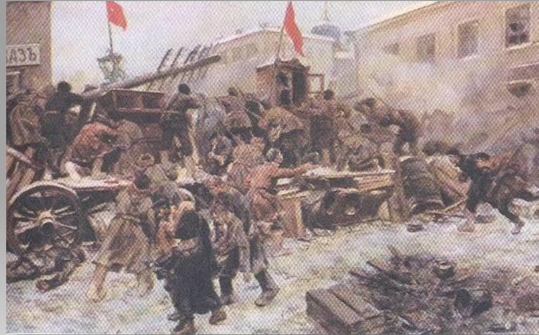
Баррикадные бои на Пресне