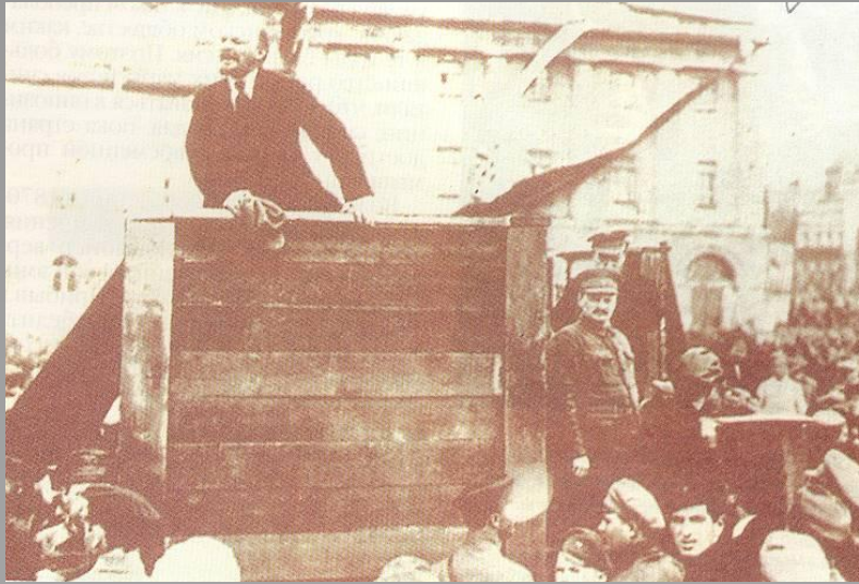
Ленин – вождь большевиков