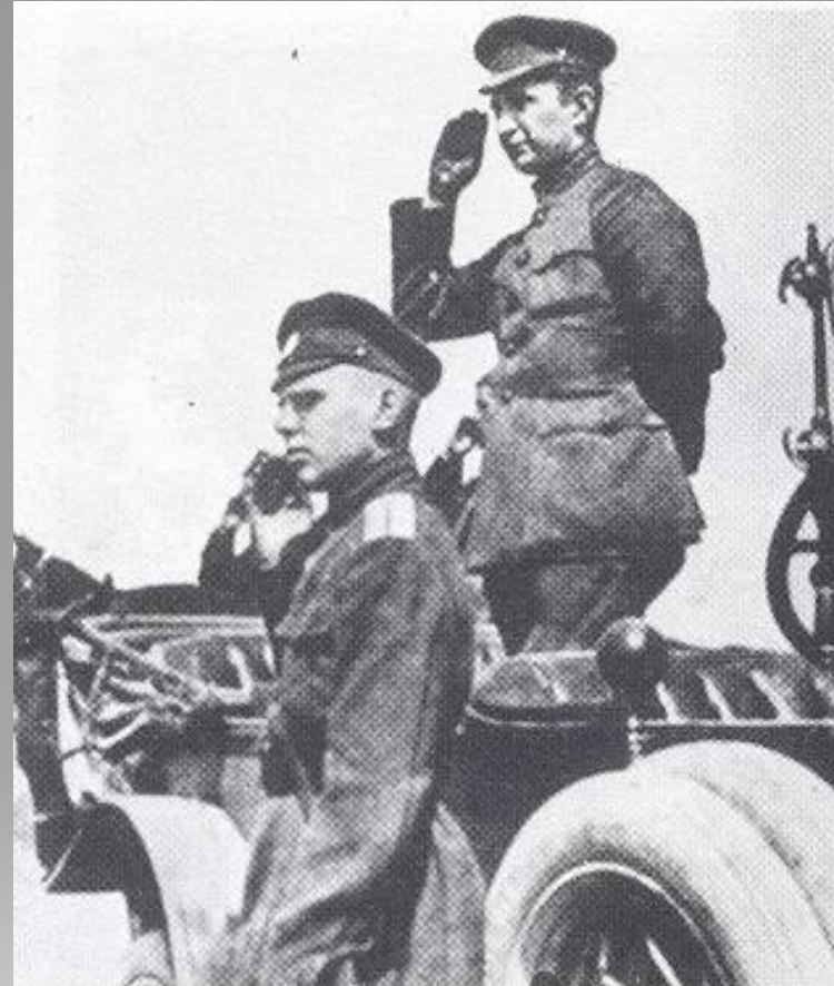
Александр Керенский – один из министров Временного правительства