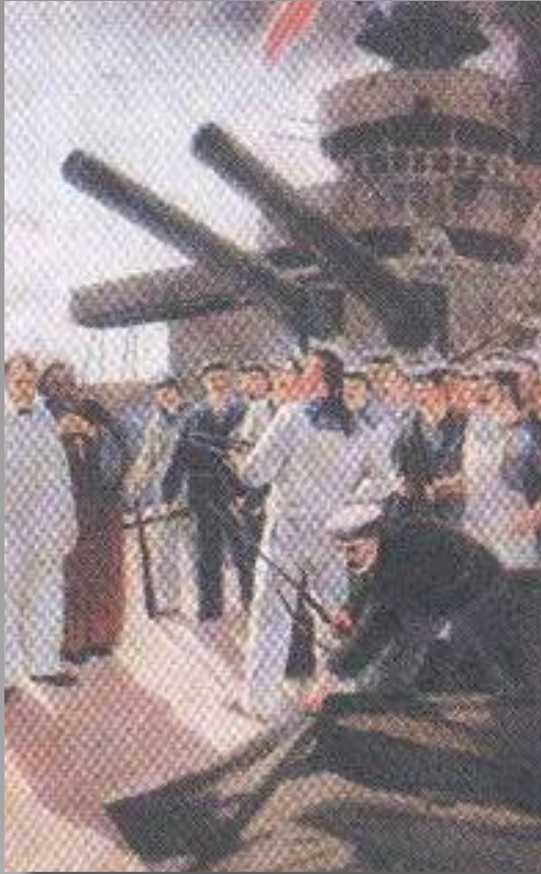
Выступления в армии и на фронте. Восстание на броненосце «Потемкин», июнь 1905 г.