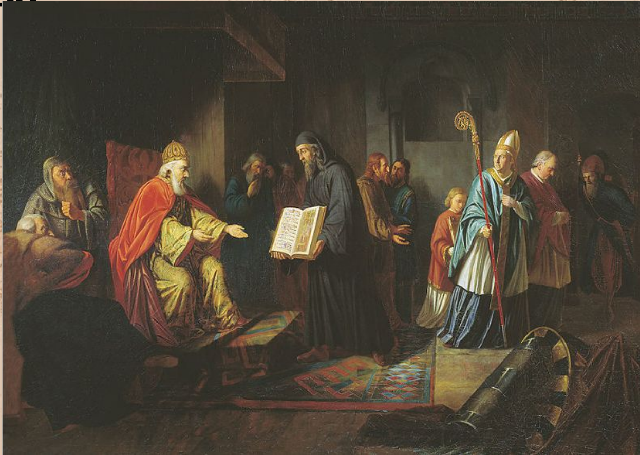
Великий князь Владимир избирает религию. Эггинг 1822 г.