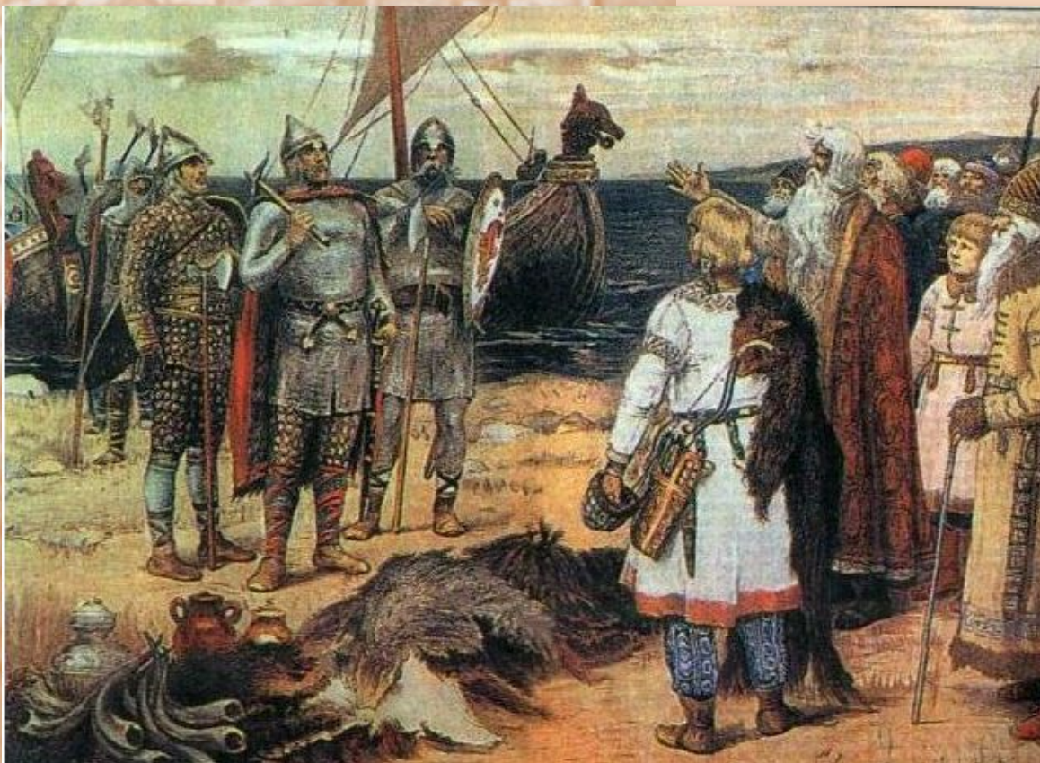
В. Васнецов: Прибытие Рюрика на Ладогу