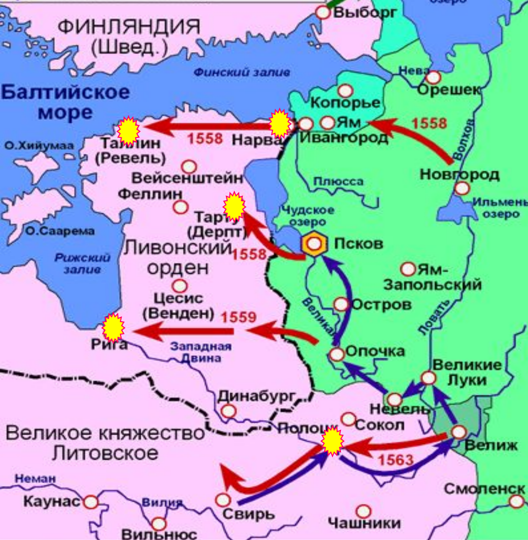
Территории утраченные Россией в результате войны