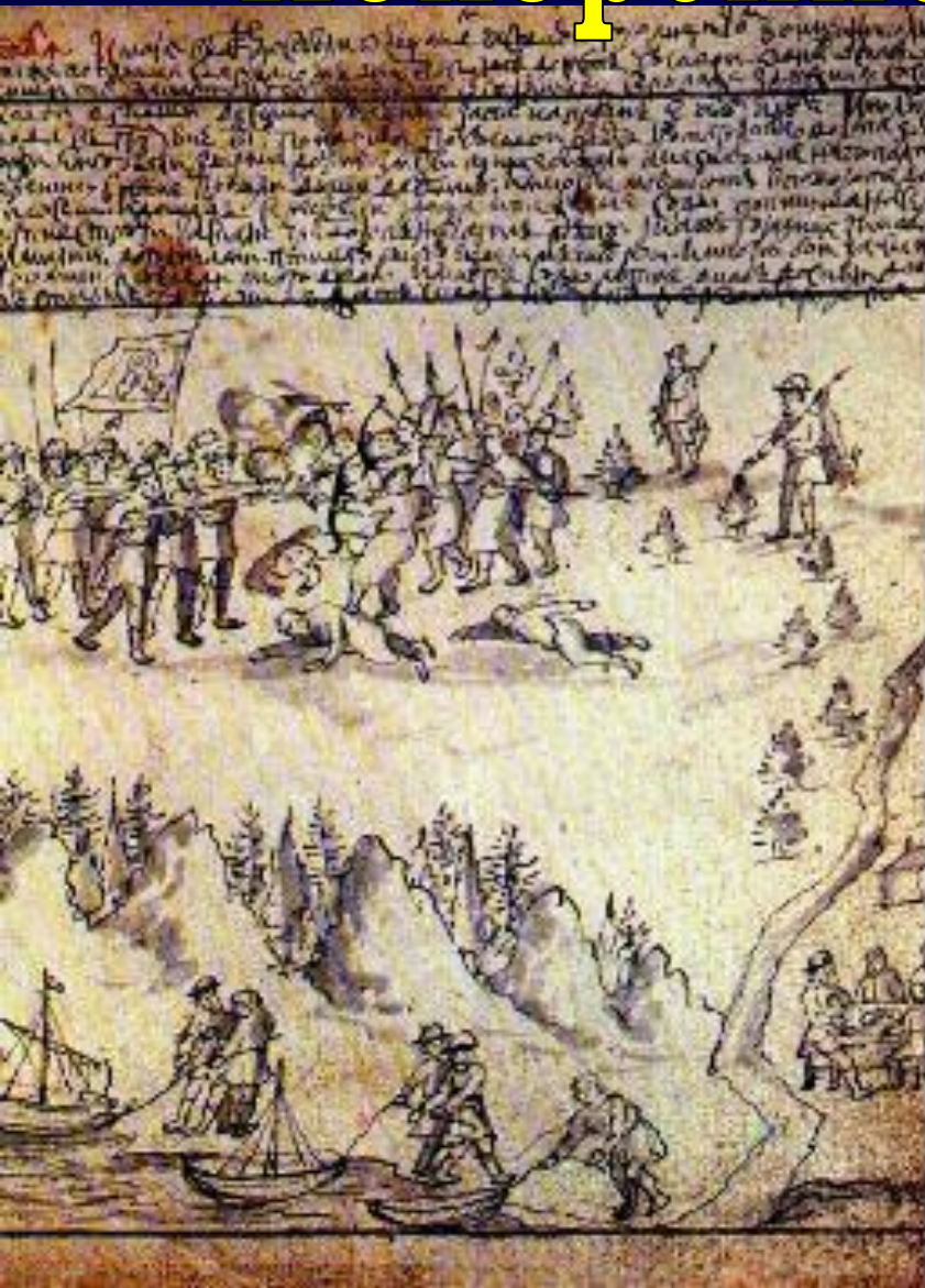
Казачи Ермака в Сибири Миниатюра 17 века.

В 1563 г. Сибирским ханом стал Кучум. Он превратил выплату ясака и возобновил набеги на русские земли. Строгановы набрали отряд казаков.