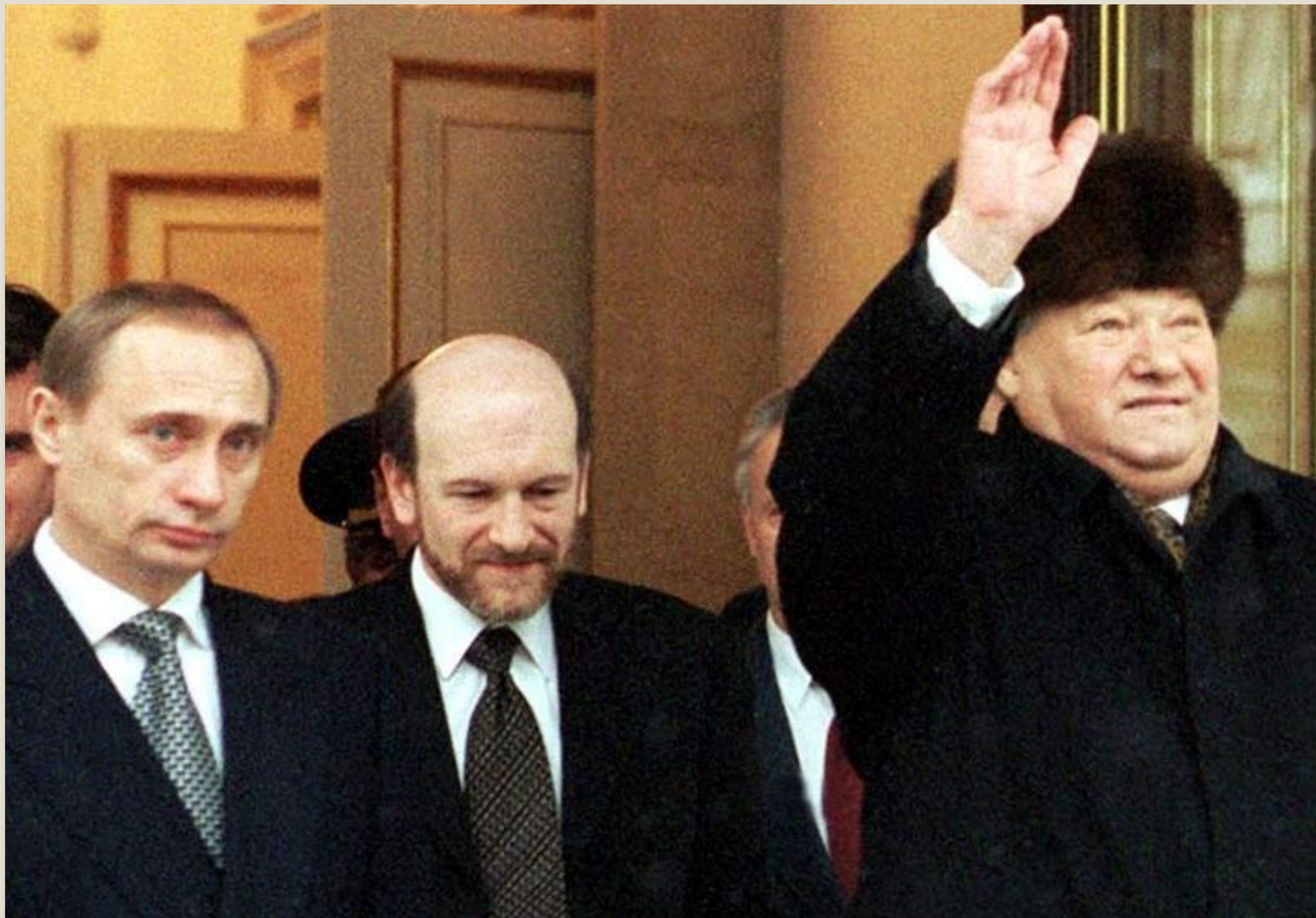
Б.Ельцин покидает Кремль, 31 декабря 1999 год.