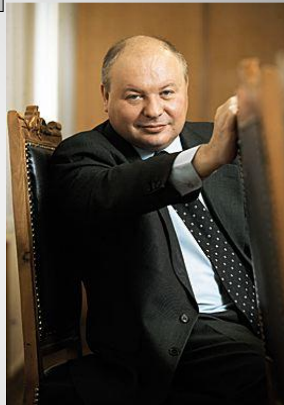
Егор Тимурович Гайдар, вице-премьер Правительства РСФСР

Цены выросли сразу в 10-12 раз , к концу 1992 г. - в среднем в 25 раз .