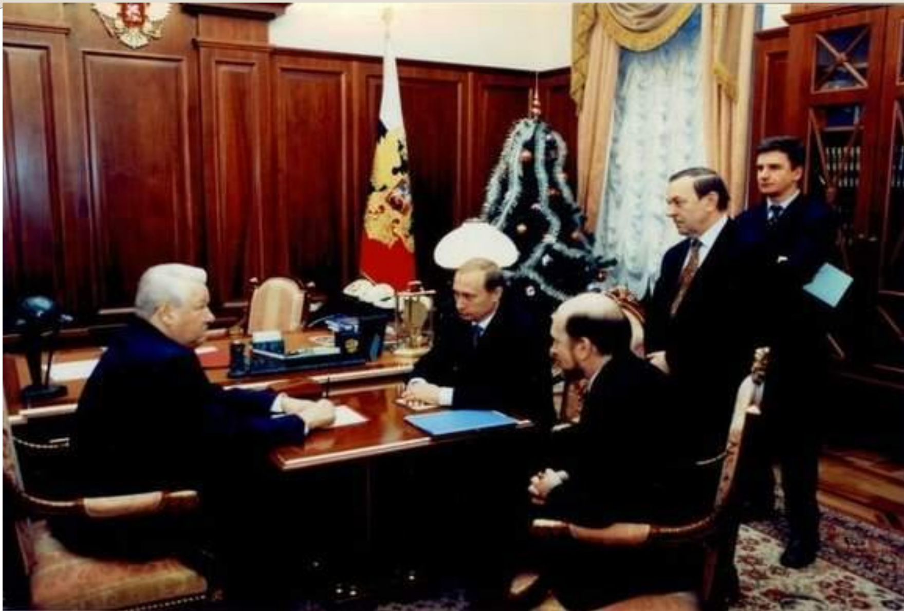
Утро 31 декабря 1999 года в кабинете президента в Кремле.