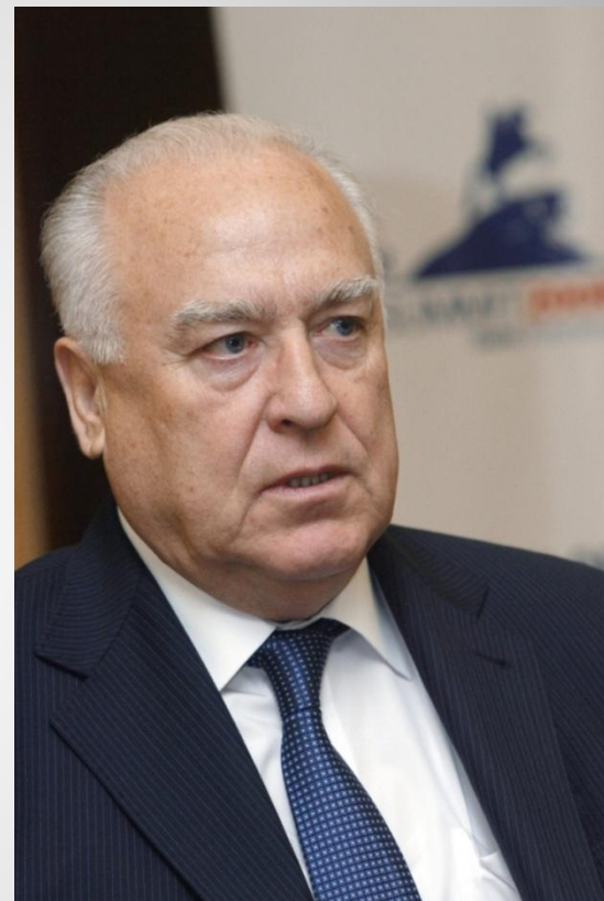
Виктор Степанович Черномырдин, Премьер-министр

Кредиты Международного валютного фонда и Всемирного банка