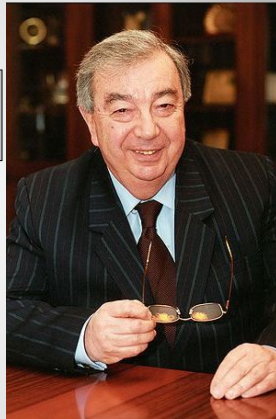
Евгений Максимович Примаков, Премьер-министр

Удалось вдвое снизить государственные расходы и выйти в профицит бюджета