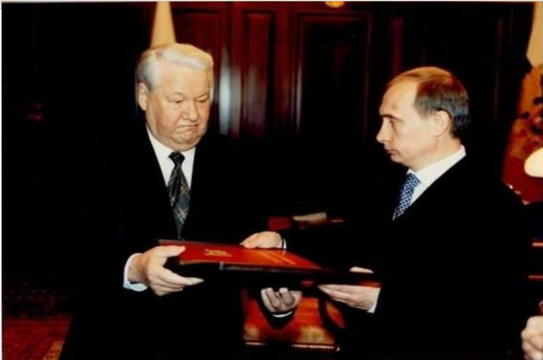
В папке указ президента о назначении премьер-министра В. В.Путина исполняющим обязанности Президента России.