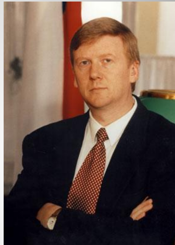
Анатолий Борисович Чубайс

Приватизация в России — процесс передачи государственного имущества Российской Федерации в частную собственность В результате приватизации значительная часть государственного имущества России перешла в частную собственность