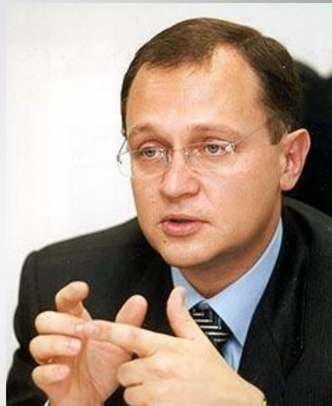
Сергей Владименович Кириенко, Премьер-министр

Курс рубля к доллару к осени 1998 г. снизился в четыре раза.