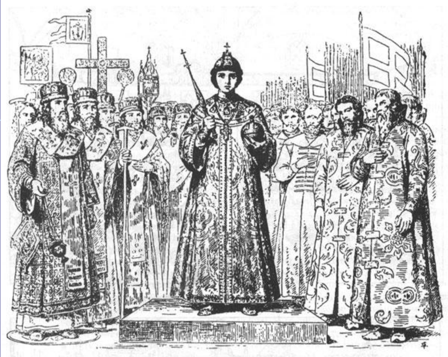
Михаил Федорович Романов