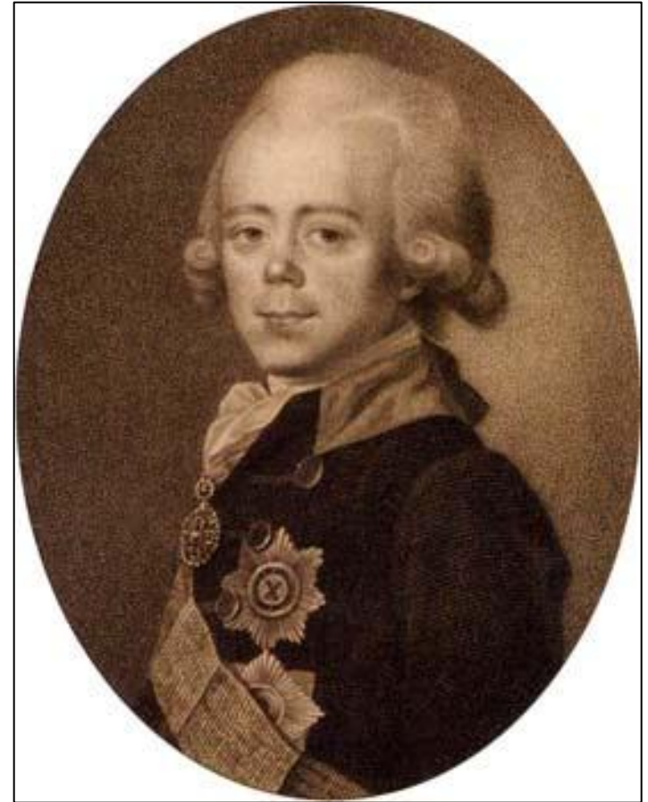
Император Павел I. Гравюра. 1818 года.