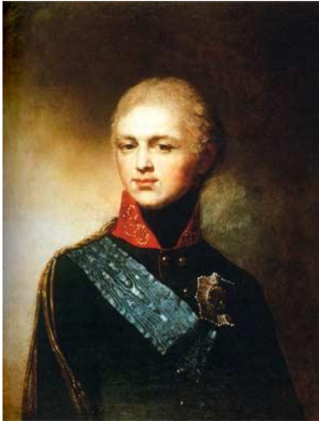
Император Александр I. Портрет работы В.Л. Боровиковского с оригинала Э.Вижэ-Лебрён. 1802.