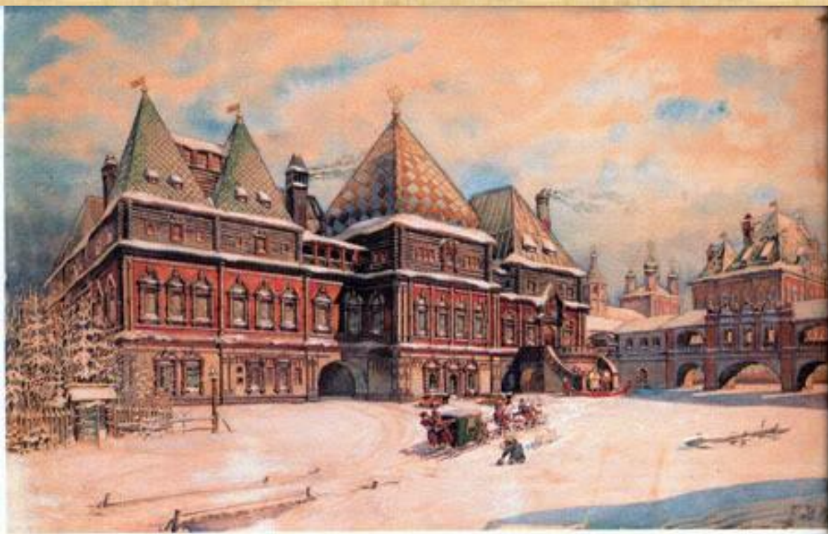
Палаты В.В. Голицына в Охотном ряду