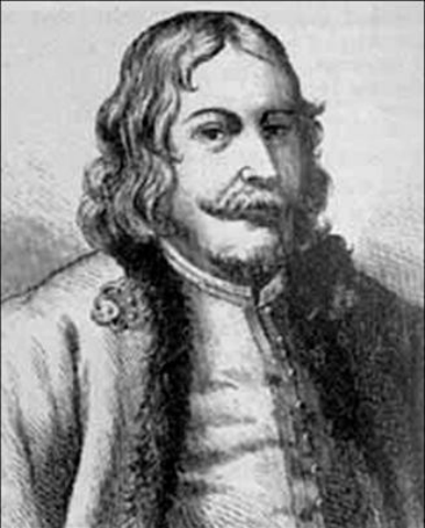
Князь В.В. Голицын