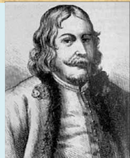
Князь В.В. Голицын

Хотел «поставить Московию на одну ступень с другими государствами»