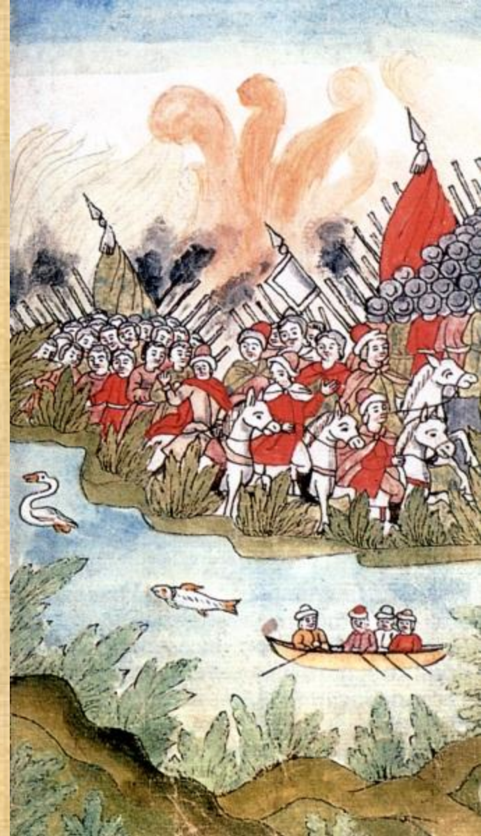
Крымские походы В.В. Голицына