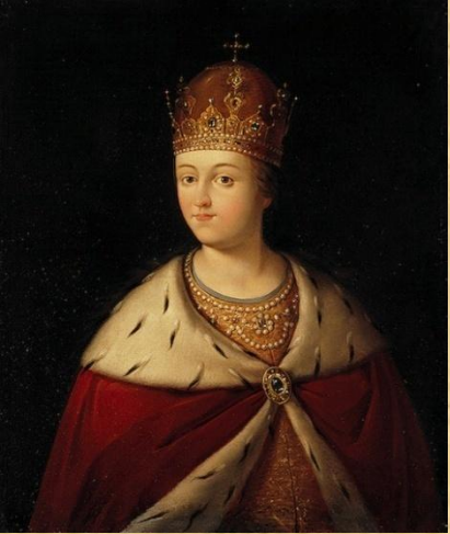
Царевна Софья (регентша) 1682-1689