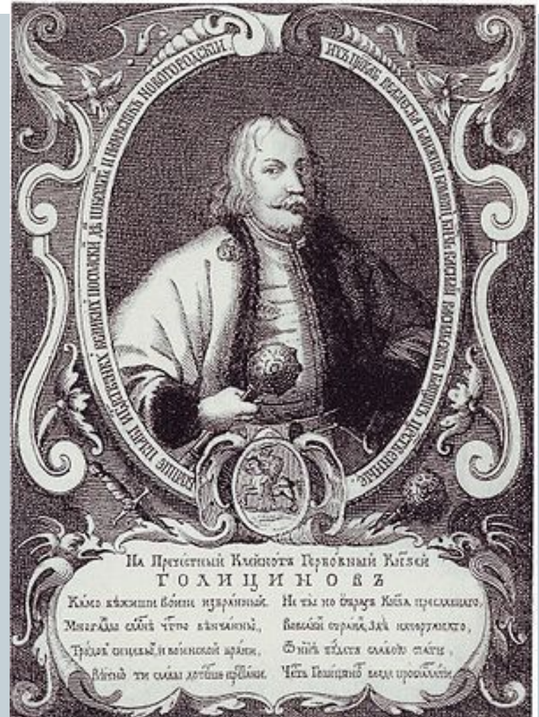
Фаворит Софьи князь В.В. Голицин