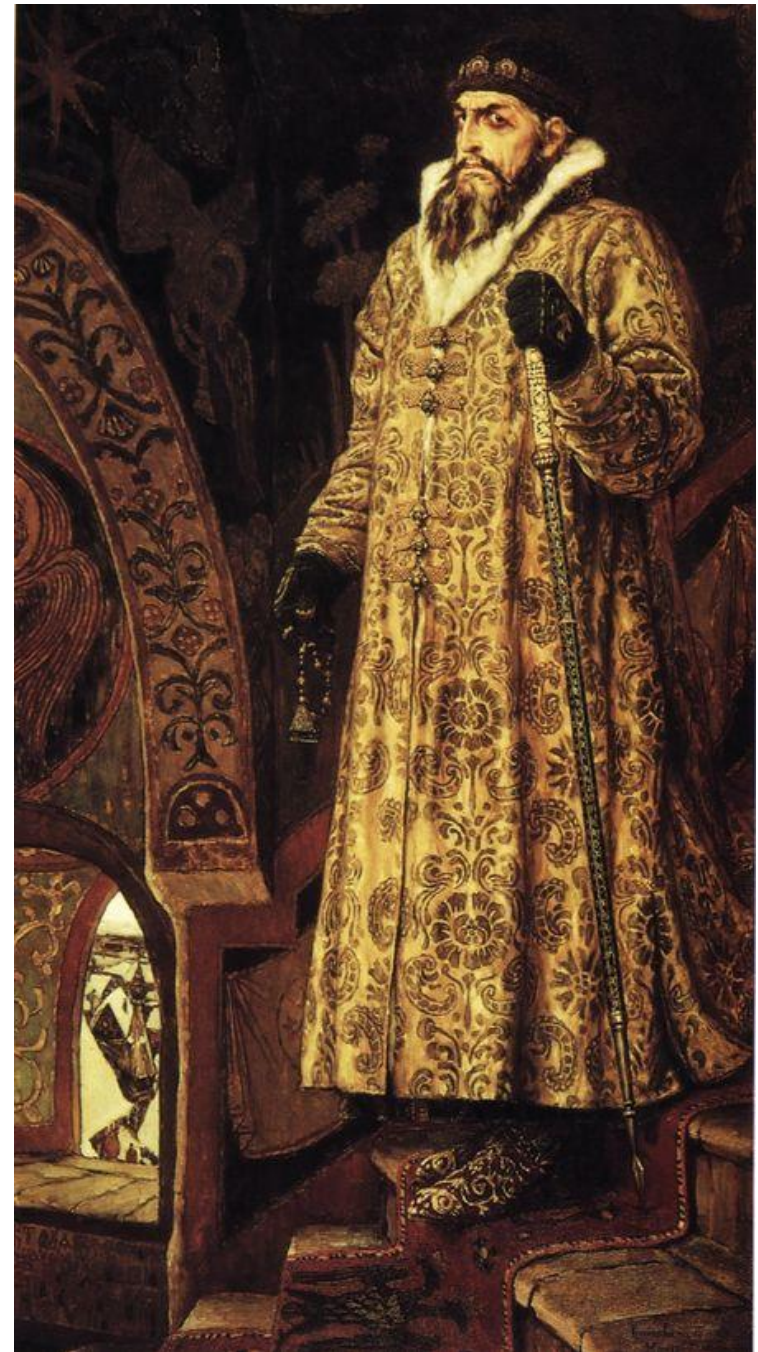
В.М.Васнецов. Иван Грозный