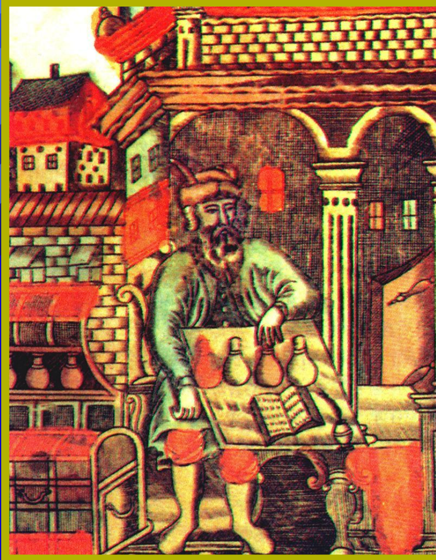
Купец, считающий деньги. Миниатюра 17 в.

Внешняя торговля шла через Архангельск и Астрахань. В сер. XVII в., защищая интересы русских купцов, правительство выслало из страны английских торговцев. В 1653 г. был принят Таможенный устав, ликвидировавший мелкие таможенные пошлины внутри страны. Новоторговый устав 1667 г. разрешал иностранцам торговать лишь в пограничных городах и устанавливал на их товары высокие пошлины. Это тормозило развитие экономики в целом, т.к. Россия отставала в промышленном производстве.