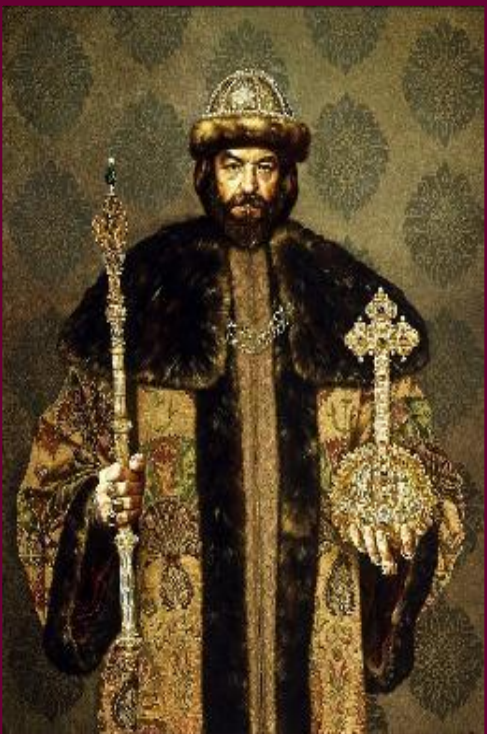
С. Присекин. Борис Годунов

1598 - 1605 гг. – правление Бориса Годунова Борис Годунов - первый выборный царь.