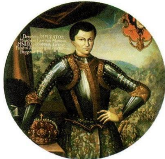
Лжедмитрий I. Миниатюра н. XVII в.

1598 - 1605 гг. – правление Бориса Годунова Борис Годунов - первый выборный царь.