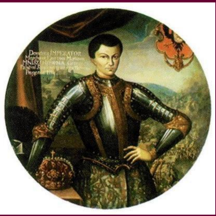
Лжедмитрий I. Миниатюра н. XVII в.

1598 - 1605 гг. – правление Бориса Годунова Борис Годунов - первый выборный царь.