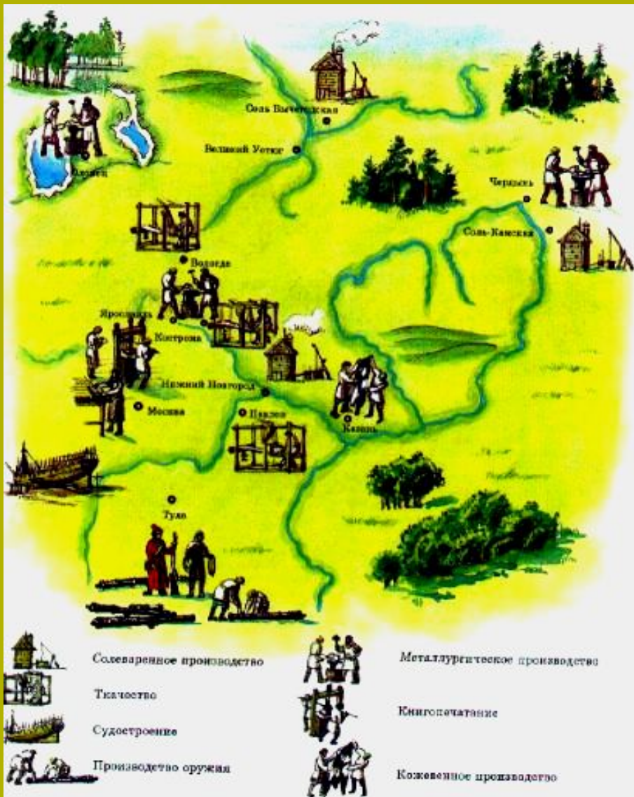
Промышленность в 17 в.

Хозяйство страны во время Смуты было разорено. Запашка сократилась в 30 раз. Многие деревни обезлюдели.