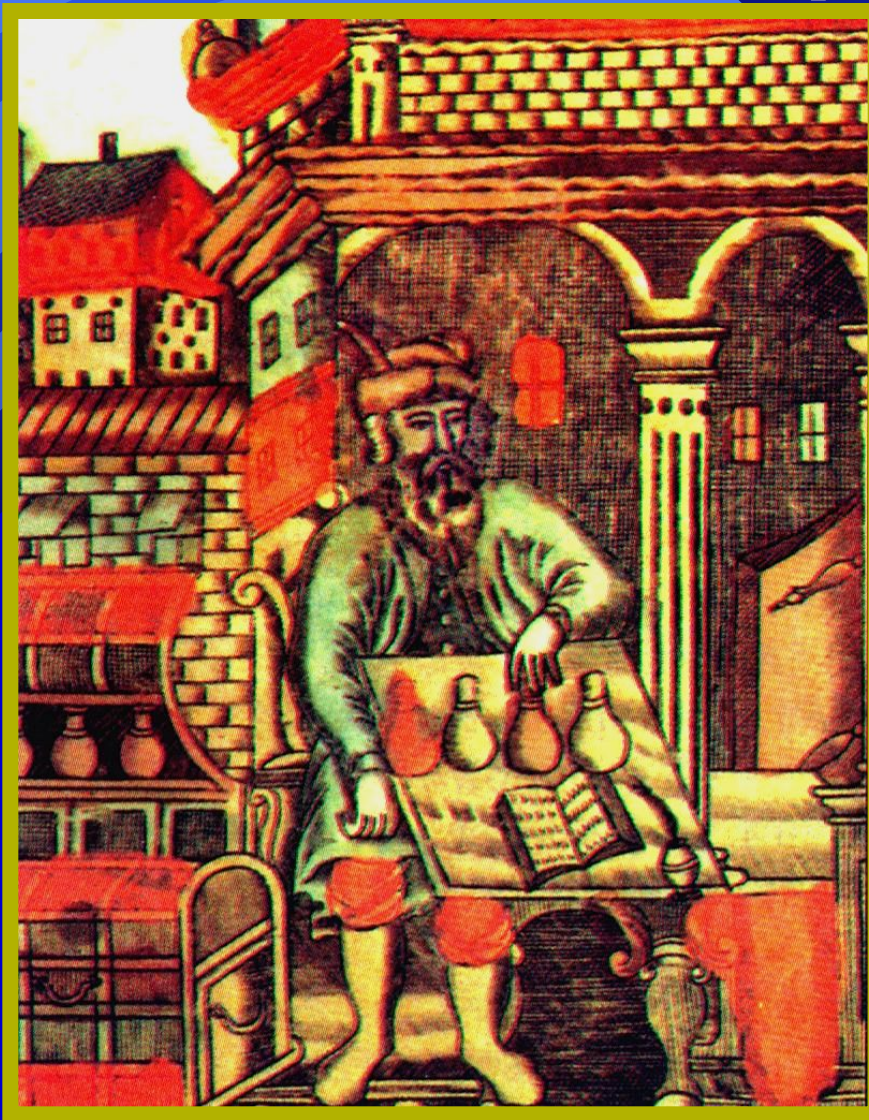
Купец, считающий деньги. Миниатюра 17 в.

Внешняя торговля шла через Архангельск и Астрахань. В сер. XVII в., защищая интересы русских купцов, правительство выслало из страны английских торговцев. В 1653 г. был принят Таможенный устав, ликвидировавший мелкие таможенные пошлины внутри страны.