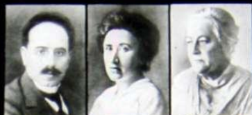
К. Либкнехт Р. Люксембург К. Цеткин

Интернационалисты, активно борющиеся против империалистической войны