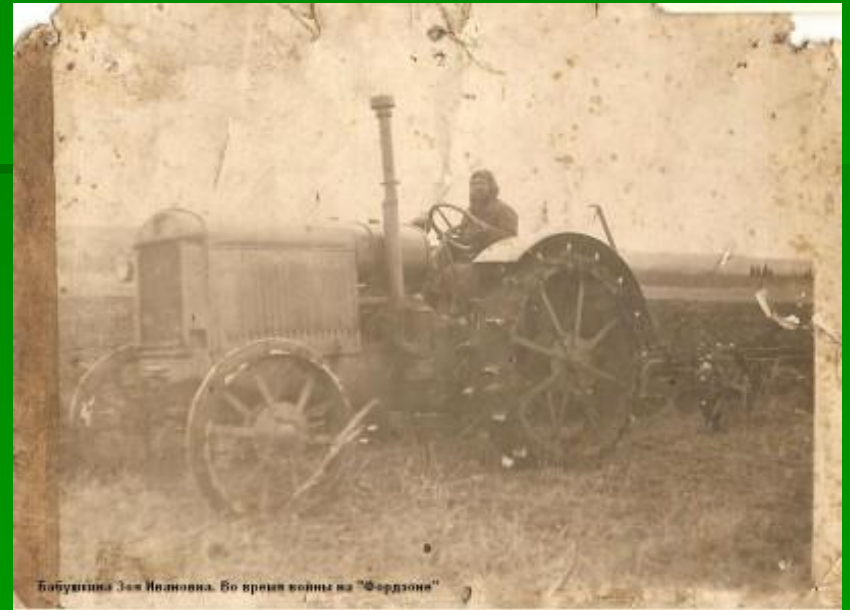
Бабушка Эм Ивановна. Во время войны на "Фордзоне"