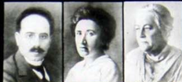
К. Либкнехт Р. Люксембург К. Цеткин

Интернационалисты, активно борющиеся против империалистической войны