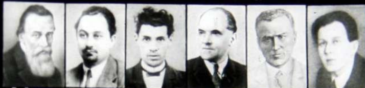
Д. Благоев Г. Димитров А. Варский У. Галлахер Д. Маклин Ф. Платтен