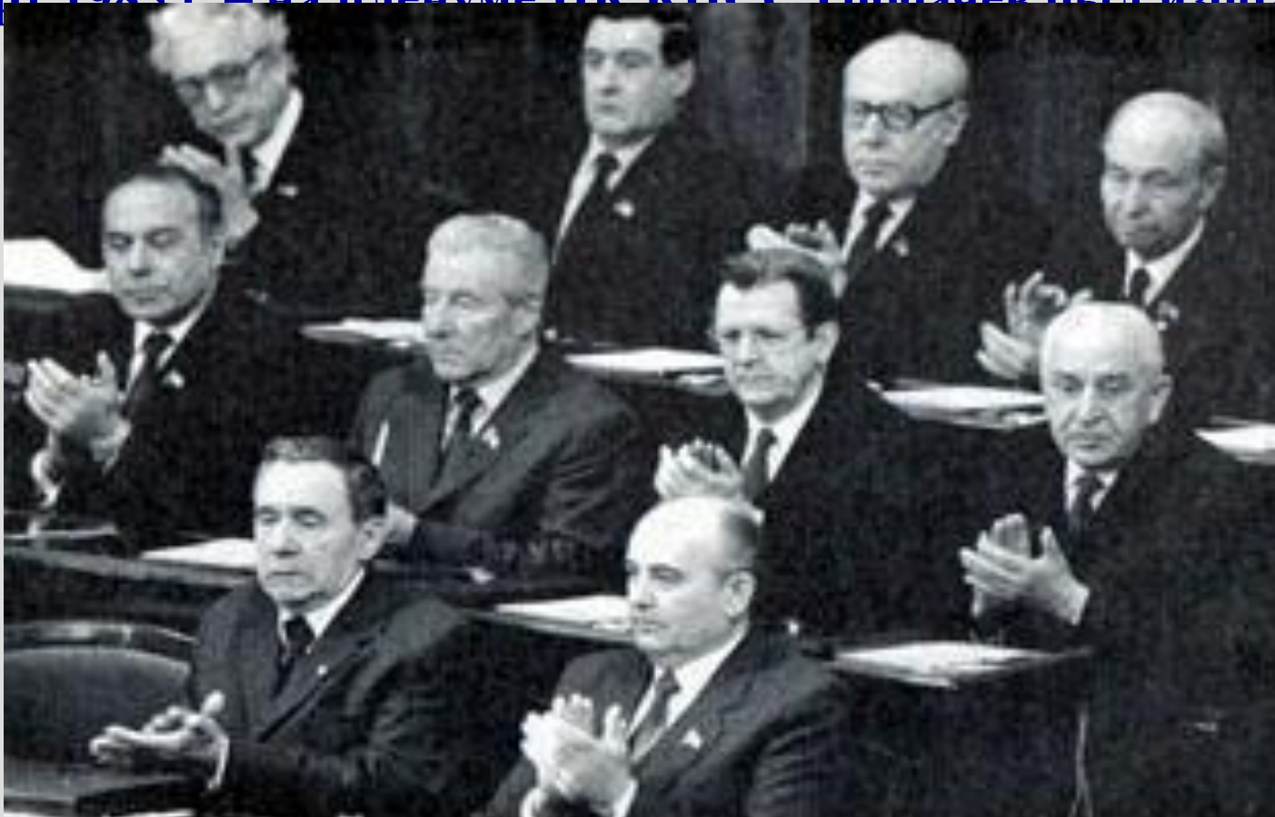
М.С. Горбачев с соратниками. 1985 г.

Март 1985 г. – на пленуме ЦК КПСС Горбачев был избран