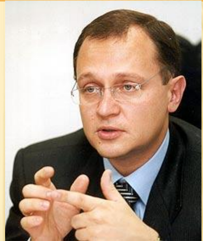
Сергей Владиленович Кириенко, Премьер-министр

Курс рубля к доллару к осени 1998 г. снизился в четыре раза.