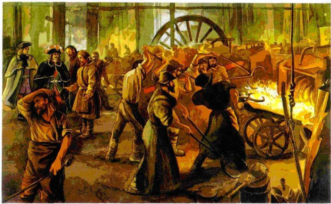
Мануфактура петровской эпохи. Современный рисунок.