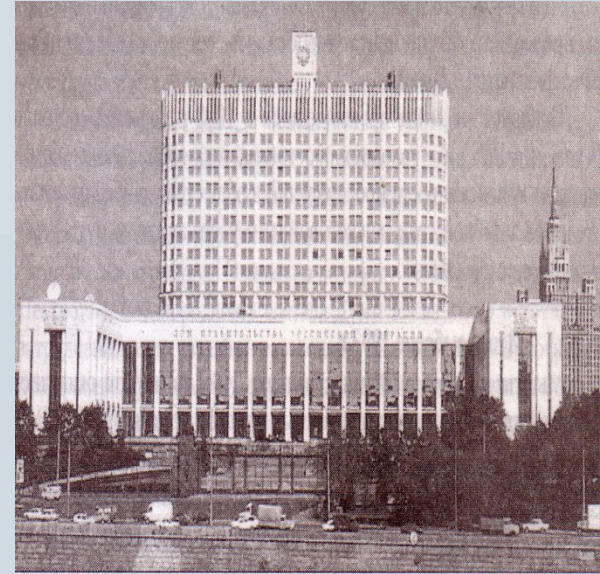
Дом Правительства Российской Федерации

Осуществляет меры по обеспечению законности, прав и свобод граждан, охране собственности и общественного порядка, борьбе с преступностью