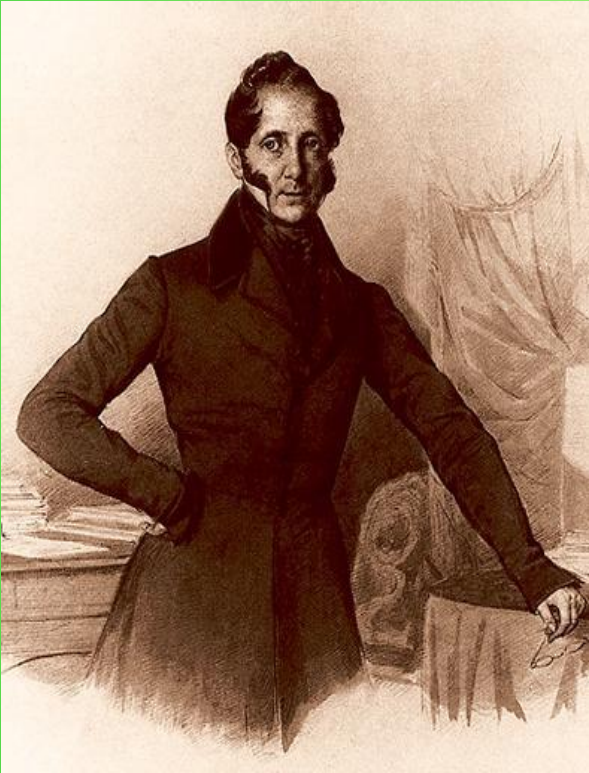
(Уваров С. С. )

1833г. - теория официальной народности (Уваров) : «Православие – самодержавие – народность»