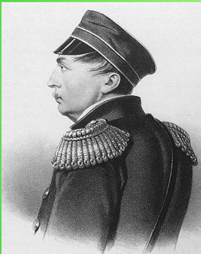
Нахимов П. С.