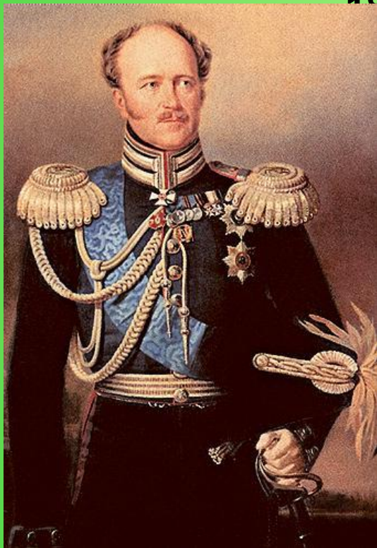
(Бенкендорф А. Х. глава III Отделения)

1826г. – III отделение канцелярии этого сыска и следствия.