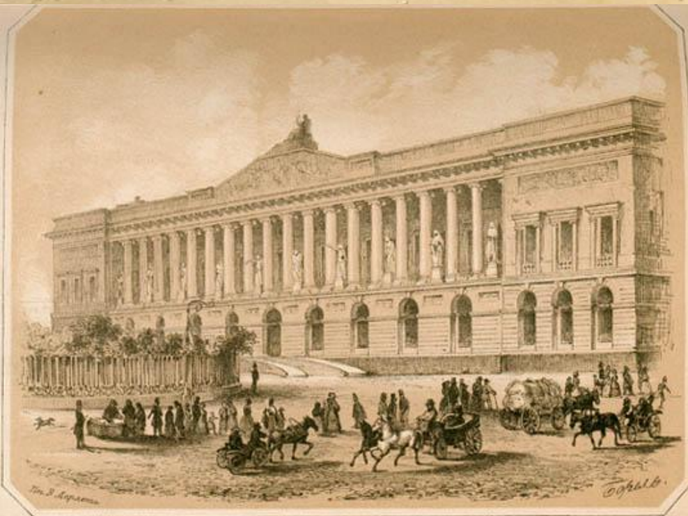
Корпус К. И. Росси. По рисунку П.Ф. Бореля. 1852

Росси украсил главный фасад библиотеки белой колоннадой. Она расположена на уровне второго этажа.