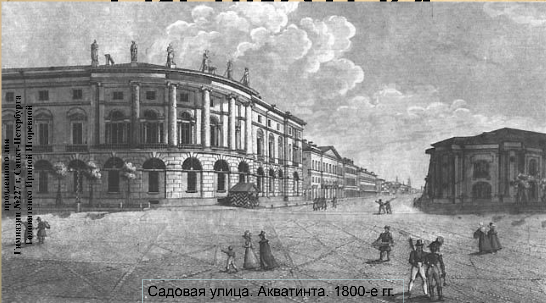
Садовая улица. Акваинта. 1800-е гг.

Презентация выполнена воспитателем группы продленного дня