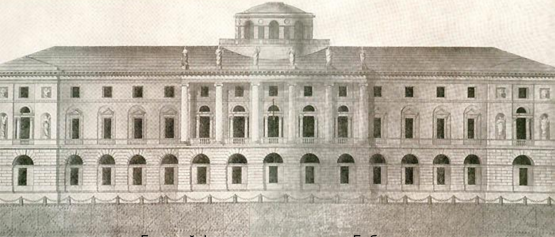
Главный фасад углового здания Библиотеки. Утвержденный проект Е.Т.Соколова. 1796 г.

Книжные сокровища Российской национальной библиотеки занимают в городе несколько разных помещений. Главное здание библиотеки расположено на углу Невского проспекта и Садовой улицы. Его лицевой фасад выходит на площадь Островского.