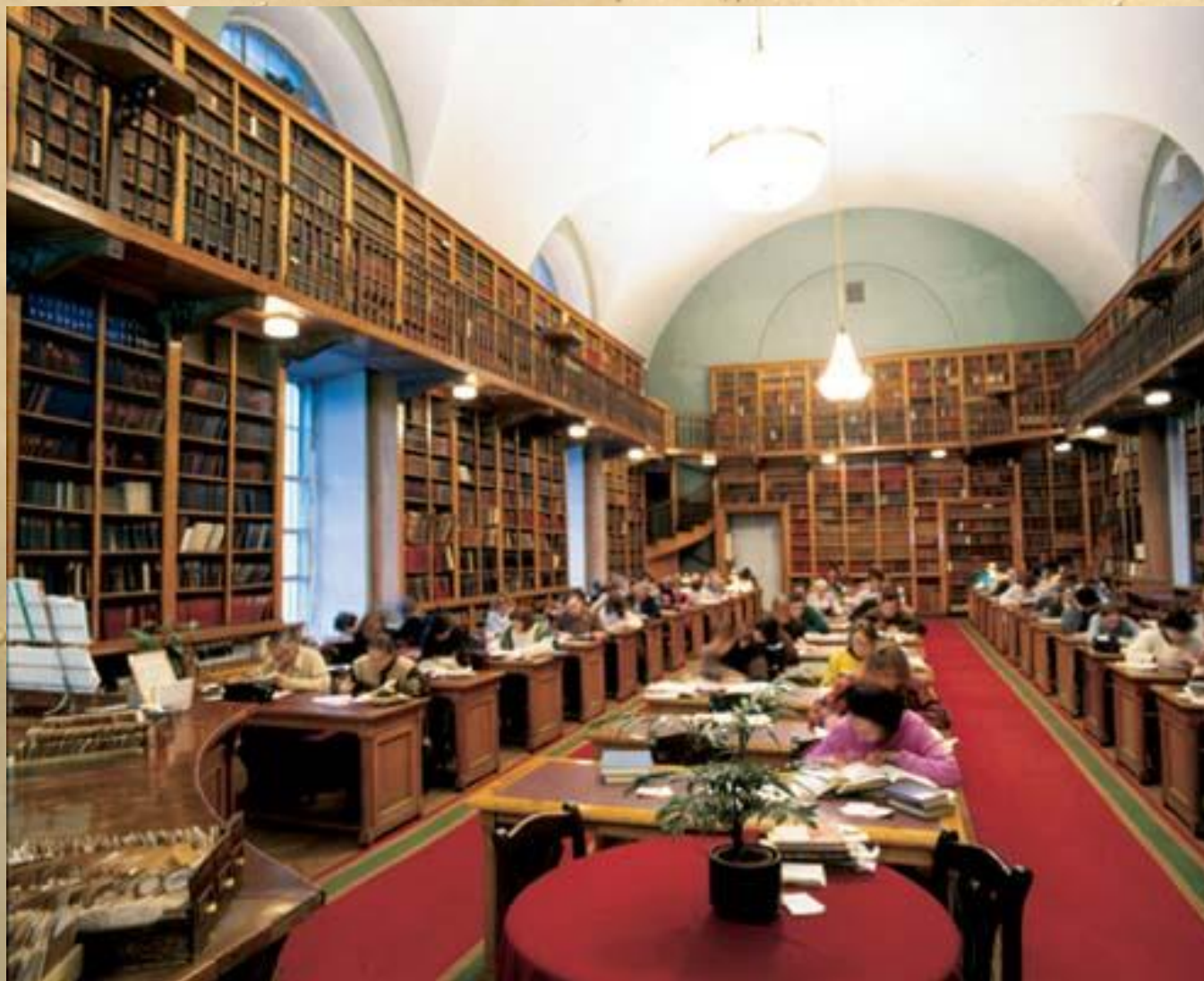
Читальный зал литературы и искусства.

В библиотеке есть книги на разных языках народов мира. Каждый день в её читальные залы приходят около 5 000 читателей.