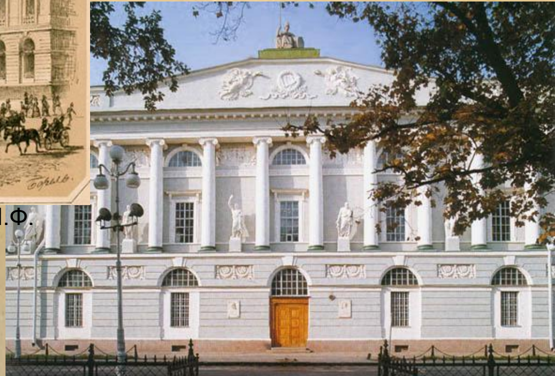
Корпус К. И. Росси. Современный вид здания 6