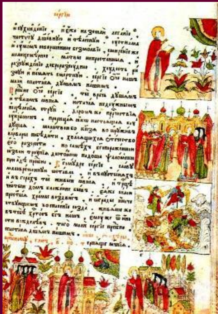
Книга 17 века.

В 17 в. появляются новые жанры в русской литературе - Сатирические сказки, Жизнеописания, стихи, переводится иностранная литература.