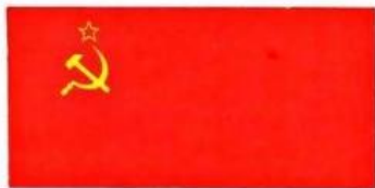
Государственный флаг СССР