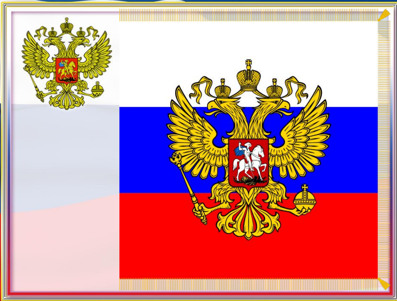
Штандарт Президента Российской Федерации