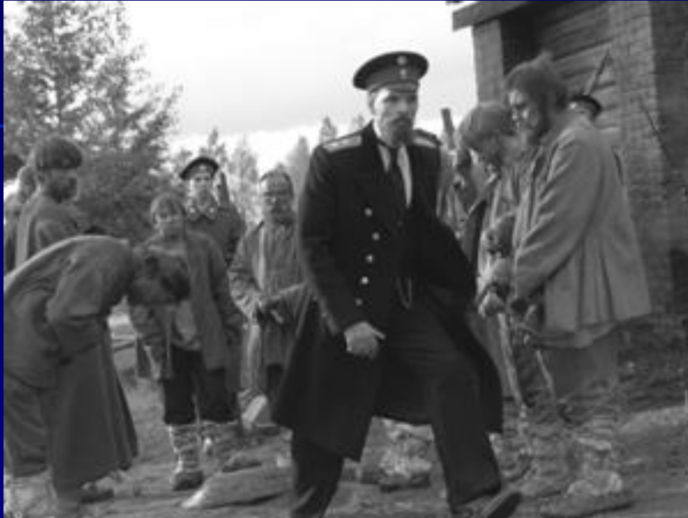
Столыпин осматривает хуторское хозяйство.