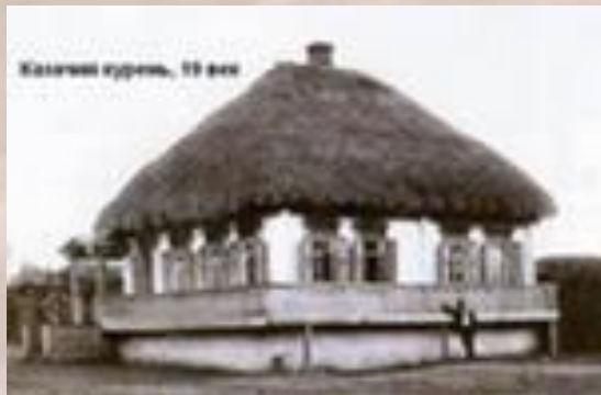
Казачий курень, 19 век