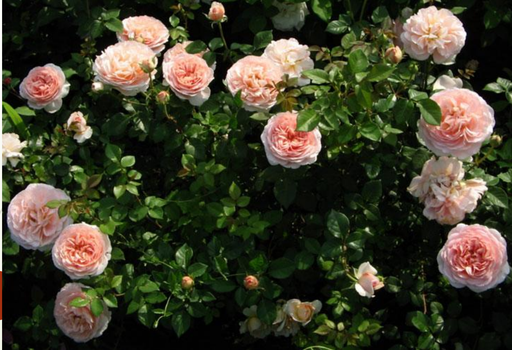
Роза королевы Великобритании.