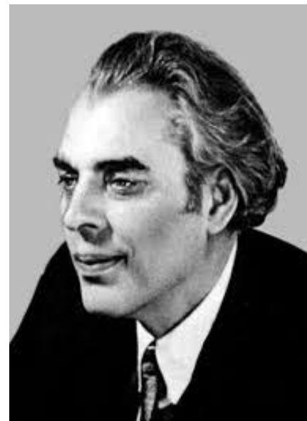
В. Земляк («Лебедина згряя», «Зелені Млини») та ін