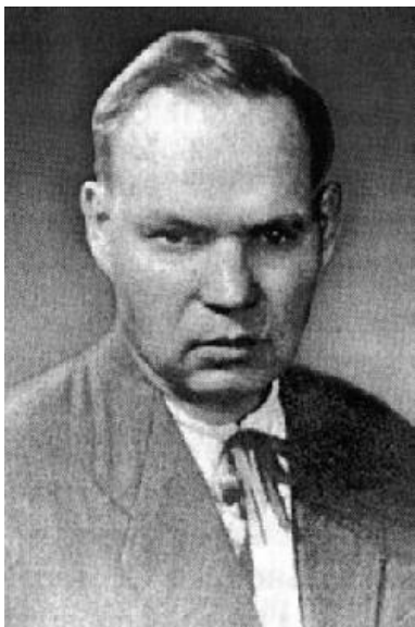
М. Стельмах («Дума про тебе», «Правда і кривда», «Чотири броди»)