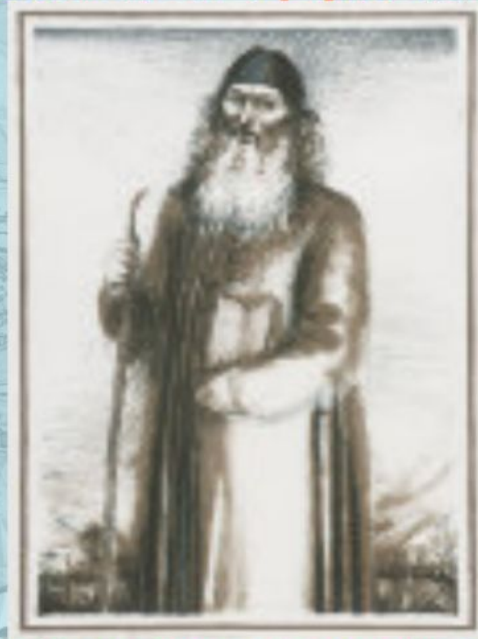
Протопоп Аввакум (1621-1682)