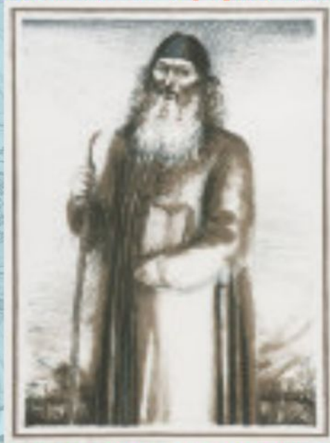
Протопоп Аввакум (1621-1682)