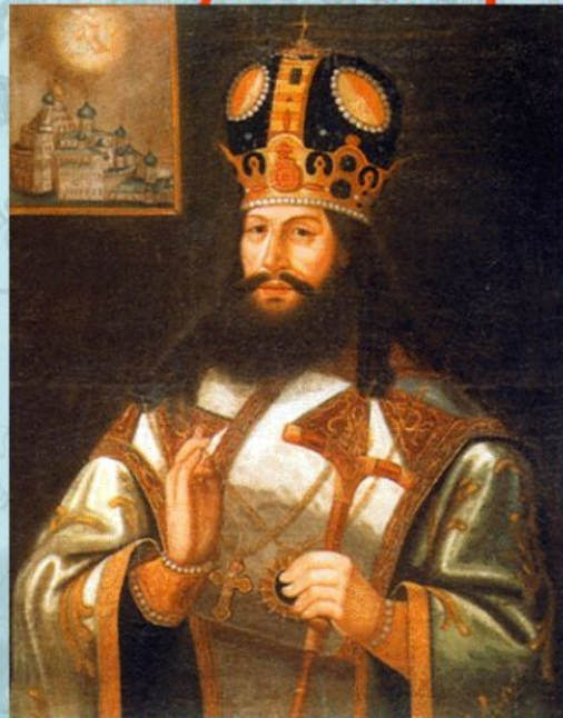
Патриарх Никон (1605-1681)