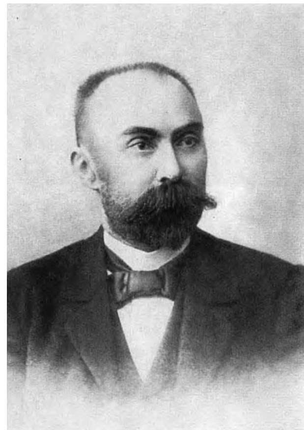
Г. В. Плеханов. 1901 г.

К. Либкнехт, К. Цеткин, А. Бебель, П. Лафарг – переписки.