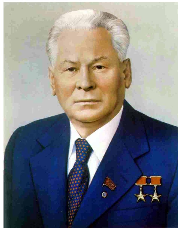
К.У. Черненко 1984 - 1985