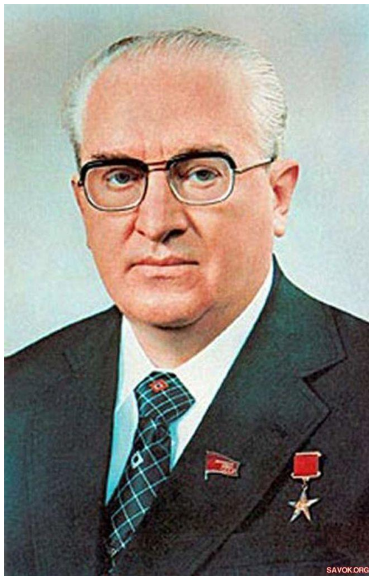
Ю.В. Андропов 1982 - 1984