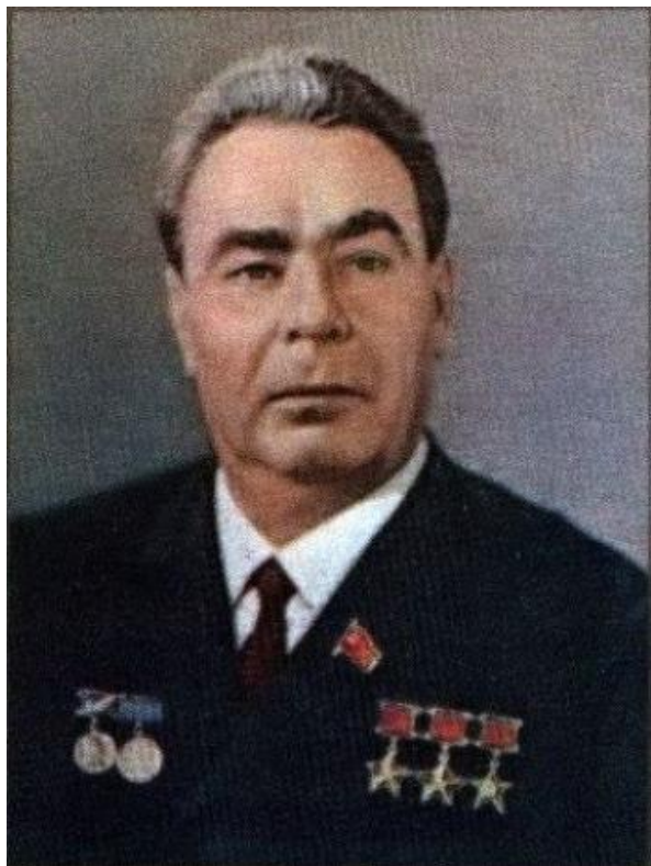
Л.И. Брежнев 1964 - 1982