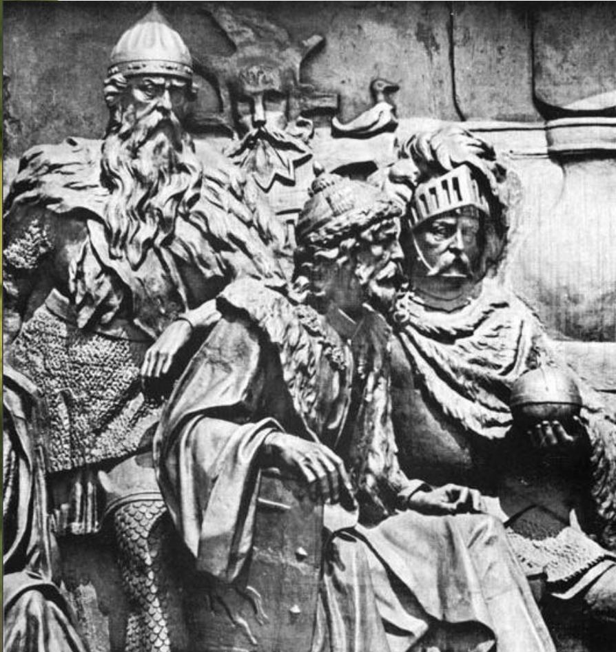
Гедимин, Ольгер, Витовт

Своего расцвета Литовское государство достигло при князе Гидемине. На полоцкий престол литовский князь посадил своего брата.