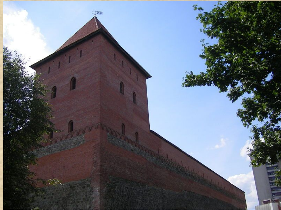
Замок Гедимина в Лиде