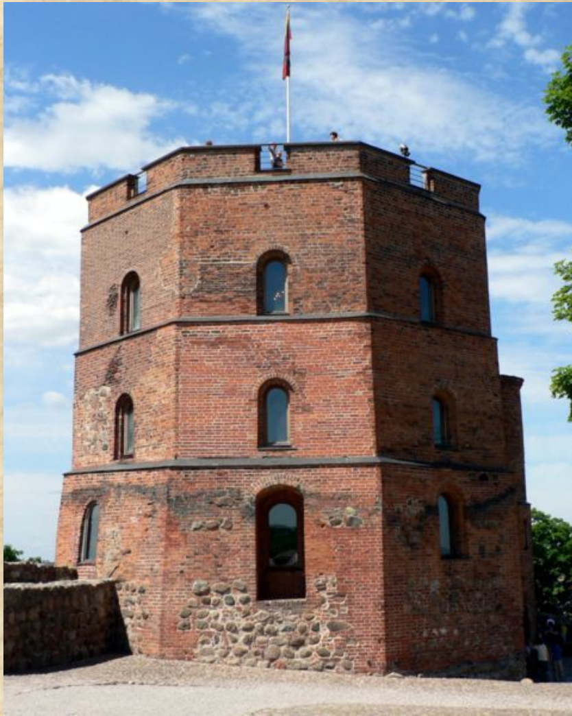
Современный вид Башни Гедимина в Вильнюсе