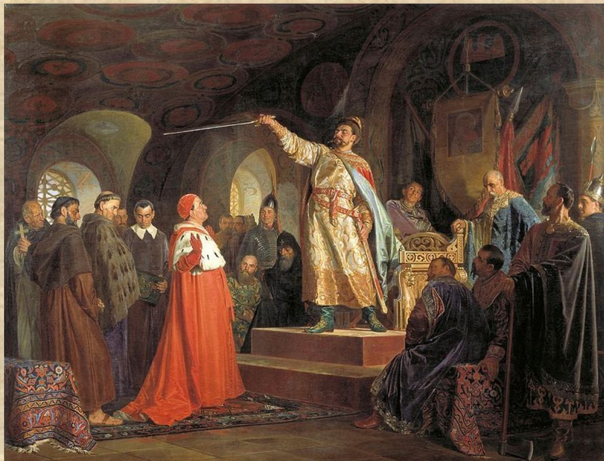
Роман Галицкий принимает послов папы Иннокентия III. Картина Н. В. Неврева, 1875 г.