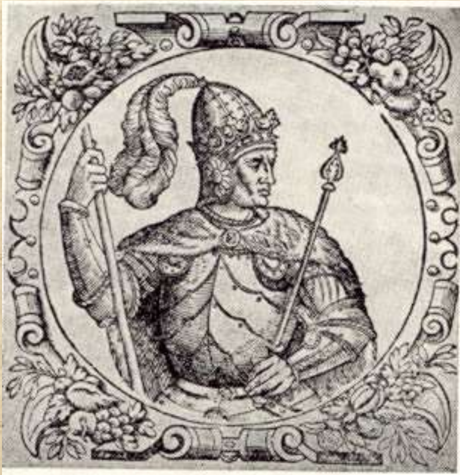
Вітовт – великий князь литовский 1392-1430)