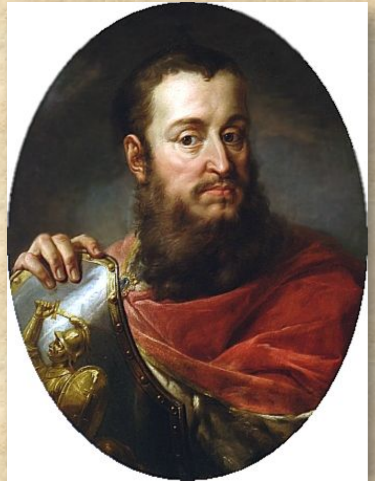
Яга́йло - великий князь литовский (1377—1392) и король польский (1386—1434). Родоначальник династии Ягеллонов.