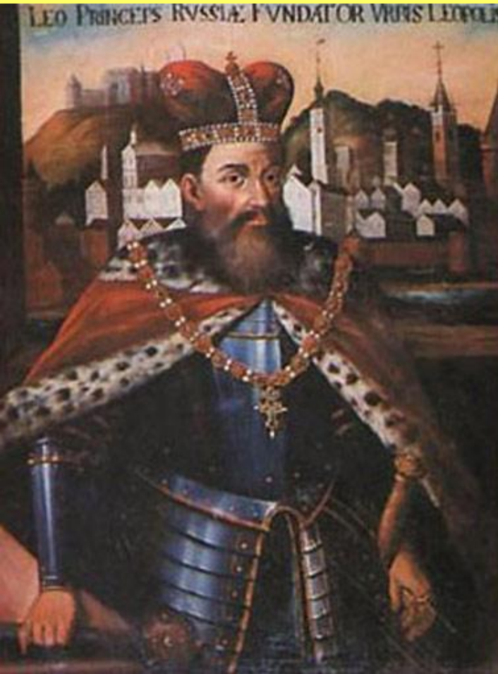
Даниил Галицкий в королевской короне и мантии.