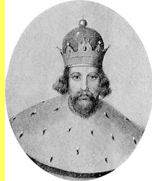
Великий князь Владимирский и Городецкий Андрей Александрович

Придя с ордынским войском, Андрей изгнал Дмитрия и разорил значительную часть земель С.-В. Руси