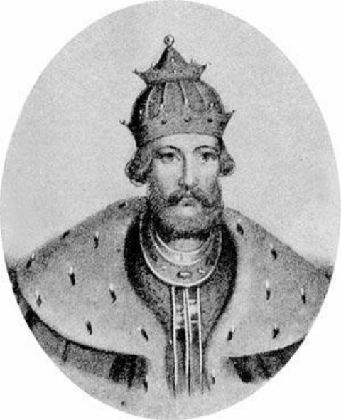
Великий князь Владимирский и Переяславский Дмитрий Александрович