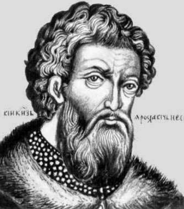
Александр Невский. Портрет из «Титулярника» XVII в.

Вдова Гюка Огуль-Гамиш утвердила Александра великим князем киевским и новгородским, а Андрея великим князем владимирским.