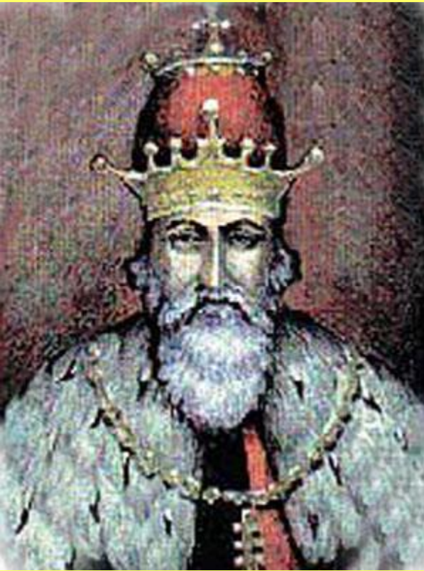
Даниил Романович, князь Галицкий, в королевской короне.

В 1250 г. Андрей женился на дочери известного своим независимым нравом галицкого князя Даниила Романовича.