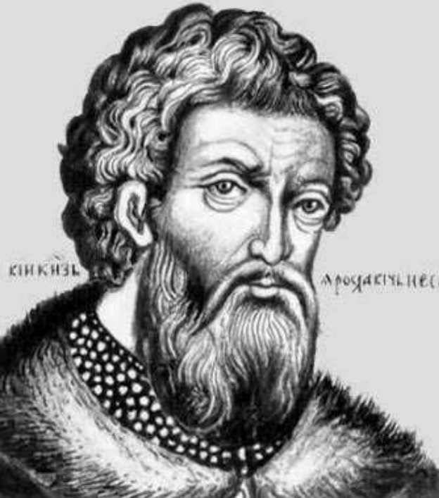
Александр Невский. Портрет из «Титулярника» XVII в.

Вдова Гюка Огуль-Гамиш утвердила Александра великим князем киевским и новгородским, а Андрея великим князем владимирским.