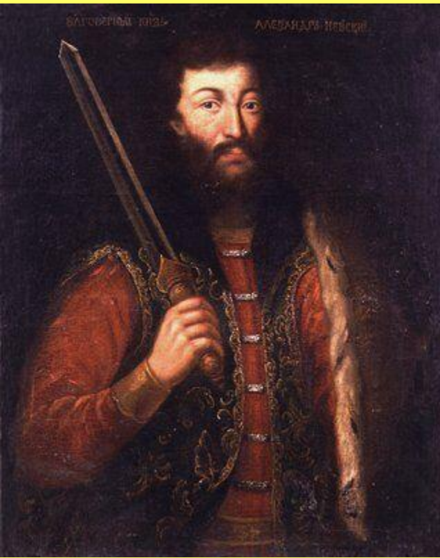
Александр Невский. Парсуна. Около 1725 г.

В 1263 г. Александр Невский был вновь вызван в Орду.