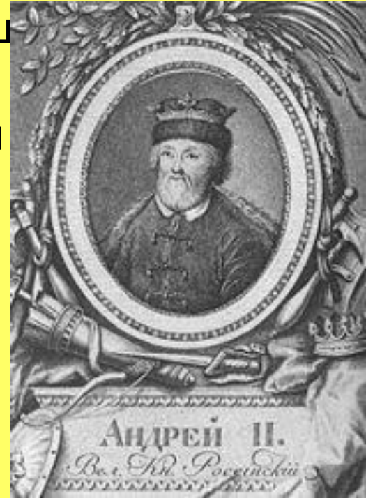
Андрей Ярославич. Неизв. художник XVIII в.

Недоволен разделом остался Александр Невский.