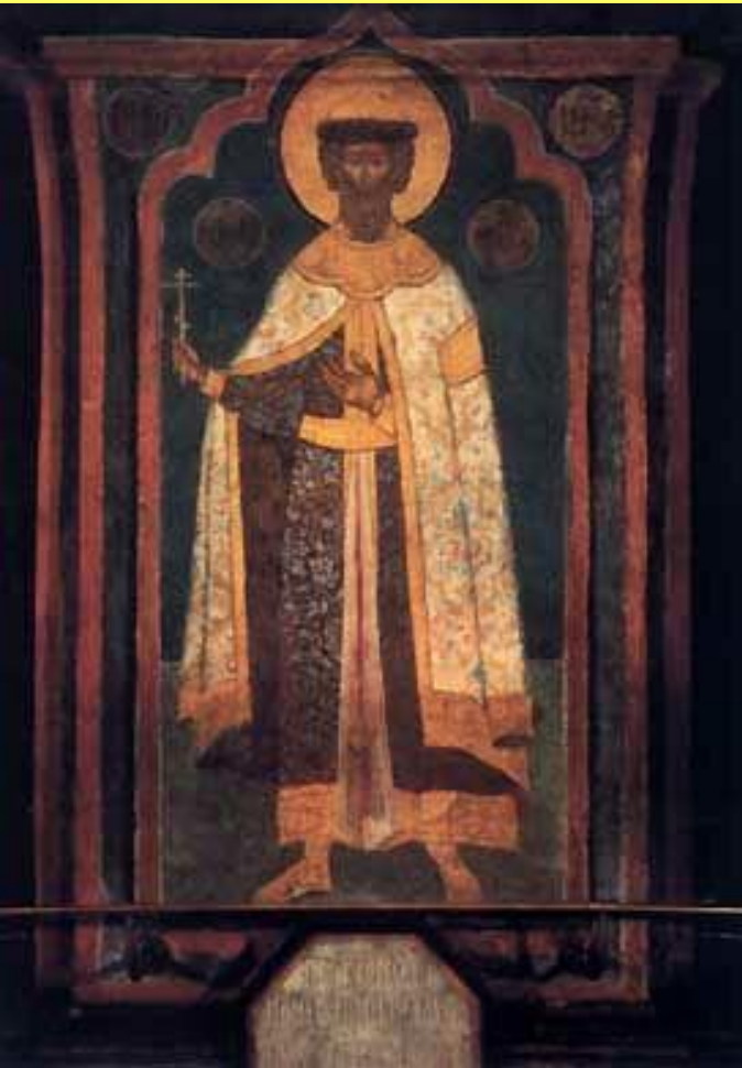
Св. Александр Невский. Фреска Архангельского собора Московского кремля.

Александр «фактически положил конец сопротивлению русских князей Орде на многие годы вперед».