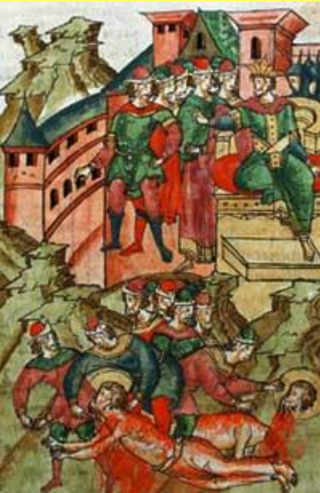
Истязание Михаила Черниговского в Орде.

В 1245 г. Ярослав Всеволодович вновь поехал в Сарай, а оттуда – в Каракорум.