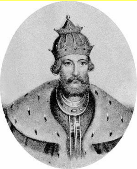
Великий князь Владимирский и Переяславский Дмитрий Александрович

Дмитрий обратился за помощью к хану Ногаю, отколовшемуся от Орды. С его помощью он вернул себе великое княжение в 1283 г.