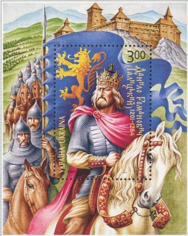
Даниил Галицкий. Современная украинская марка.

Одновременно с Неврюевой ратью Батый направил войско Куремсы против Даниила Галицкого.