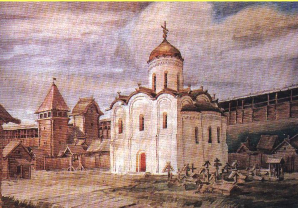
Переяславль-Залесский. Спасо-Преображенский собор. Реконструкция.

В бою под Переяславлем-Залесским войска Андрея , и его брата Ярослава потерпели поражение.