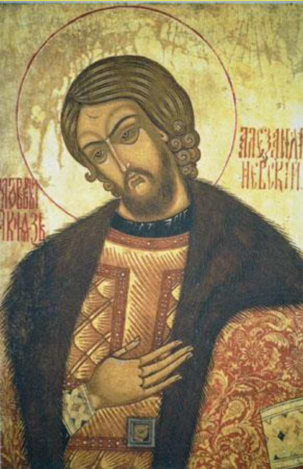
Святой благочестивый князь Александр Невский. Икона.

В 1257 г. Орда провела на Руси перепись населения – «число».