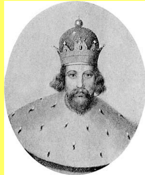
Великий князь Владимирский и Городецкий Андрей Александрович

В 1293 г. Андрей пришел на Русь с огромным ордынским войском – Дюденовой ратью.