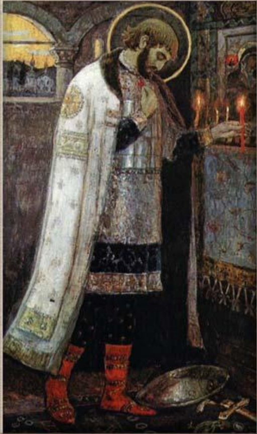
Александр Невский. Худ. А.В. Нестеров

Александр Невский оставался великим князем Владимирским в 1252–1263 гг. На протяжении своего великого княжения он проводил политику беспрекословного подчинения Орде. В 1255 г. «меньшие» новгородцы изгнали сына и наместника Александра Василия и призвали на княжение брата Александра Ярослава Ярославича, который в 1252 г. поддерживал Андрея Ярославича, пытавшегося противостоят Орде.