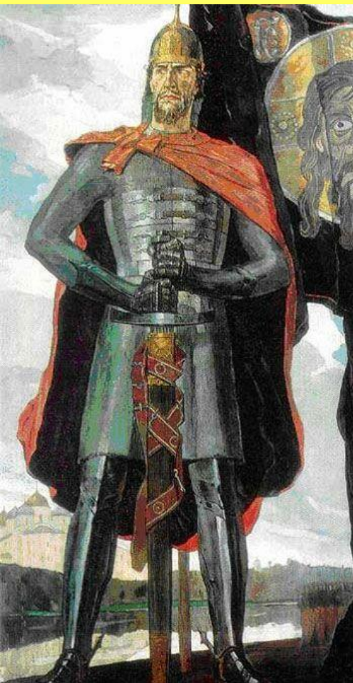
Александр Невский. Худ. П. Корин.