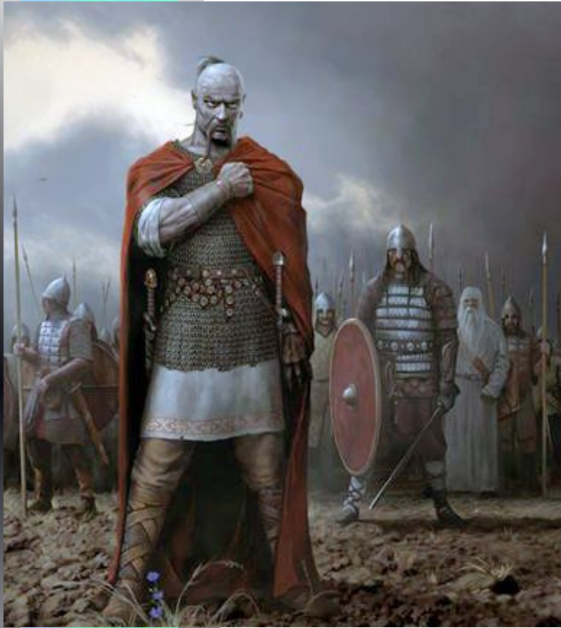
Князь Святослав – русский Александр Македонский