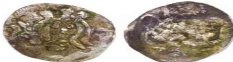
Монета Ягайло Ольгердовича, Вильно, 1387-1388 гг. Серебро, диаметр 14 мм, вес 0.60 гр.