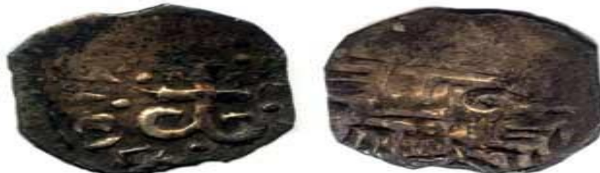
Монета Александра Наримонтовича, Стародуб, 1367-1370 гг. Серебро, диаметр 16 мм, вес 1.45 гр.