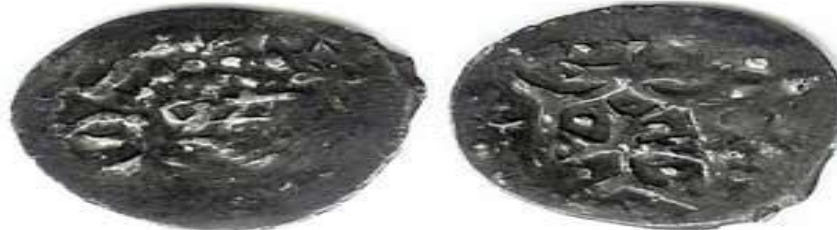
Монета Владимира Ольгердовича, Киев, 1363-1377 гг. Серебро, диаметр 14 мм, вес 0.50 гр.