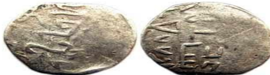
Монета Дмитрия Ольгердовича, Брянск, 1373-1376 гг. Серебро, диаметр 16 мм, вес 1.10 гр.