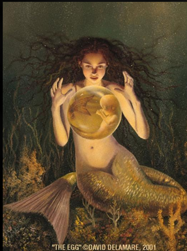
"THE EGG" ©DAVID DELAMARE, 2001

Дети являются постоянным объектом преследований и вредоносных действий РУСАЛКИ, которая наказывает их за внеурочное появление в цветущем ржаном поле, гоняется за ними, щекочет, душит своей «железной цыцкой». похищает. «Не ходи в жито,— угрожали на Воляни детям в период Русальной недели,— а то русалка заставит тебя нянчить своего ребенка». О детях, погибших и умерших на Русальной неделе, в Полесье говорили: «Русалки забрали к себе».