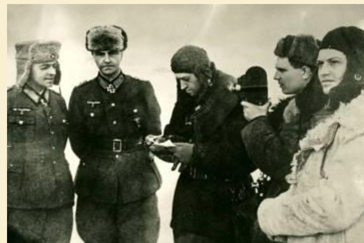
А так они закончили свой путь под Сталинградом

В окружении оказалось 330 тыс. человек во главе с фельдмаршалом Паулюсом. В январе 1943 г. после ультиматума советские войска разрезали вражескую группировку надвое и 2 февраля немцы капитулировали. Их общие потери составили 800 тыс. человек, 2 тыс танков. 3 тыс. самолетов.