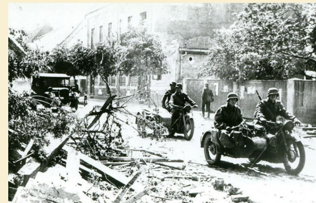
• Так они начинали