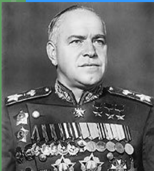
Г. К. Жуков

4. Какого полководца назвали «Маршал Победы»?