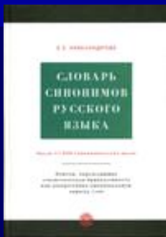
АЛЕКСАНДРОВА З.Е. СЛОВАРЬ СИНОНИМОВ РУССКОГО ЯЗЫКА. М., 2004.