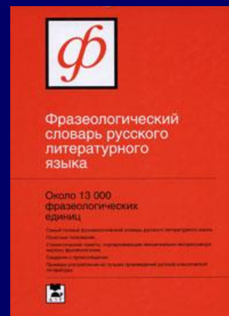
ФЁДОРОВ А.И. ФРАЗЕОЛОГИЧЕСКИЙ СЛОВАРЬ РУССКОГО ЯЗЫКА. М., 2001.