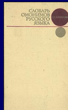
АХМАНОВА О.С. СЛОВАРЬ ОМОНИМОВ РУССКОГО ЯЗЫКА. М., 2002.