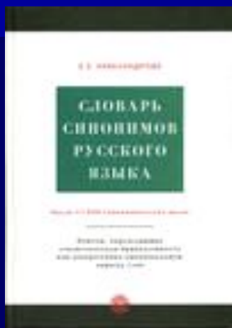
АЛЕКСАНДРОВА З.Е. СЛОВАРЬ СИНОНИМОВ РУССКОГО ЯЗЫКА. М., 2004.